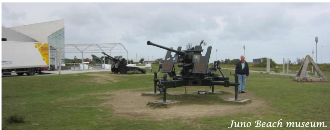
Juno Beach museum.

Ved Juno Beach så vi et canadisk museum, der lå det sted hvor Canadierne på D- dagen gik i land. Der var et stort mandefald og, det var til at forstå, når man så deres udstyr, det var geværer hvor de skulle tage ladegreb for hvert skud. Det var et meget levendegjort museum, der efterlod et stærkt indtryk af, hvordan det var at være blandt landgangstropperne.