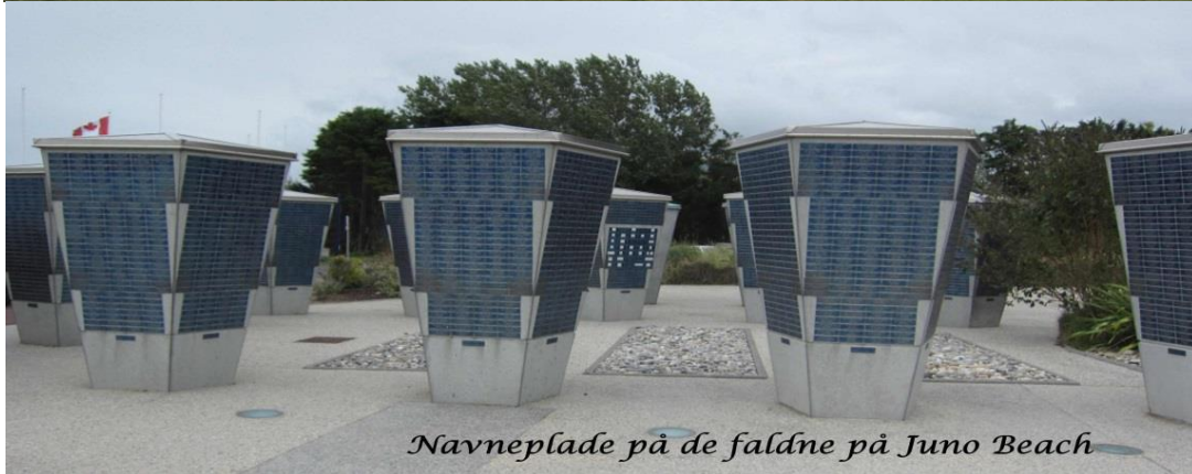
Navneplade på de faldne på Juno Beach

Vi kørte forbi næsten alle invasionsstrandene. De forskellige store kirkegårde undlod vi at besøge, men vi faldt tilfældigt over en række af de mindre, hvor der stod gravsten på gravsten med eller uden navn.