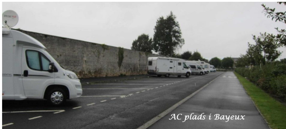
AC plads i Bayeux

Ac plads og tømning havde vi også fundet i et hæfte der hedder Calvados Un amour de Normandie www.calvados-tourisme.com , som vi fik på et turistkontor.