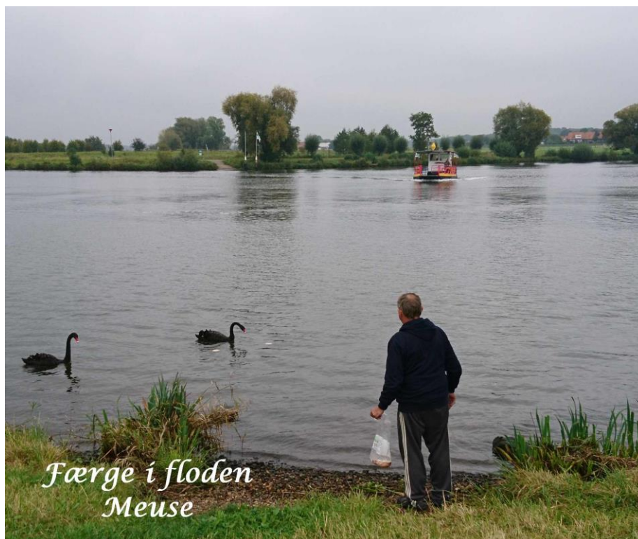
Færge i floden Meuse

En dejlig stille og naturskøn plads med sorte svaner, skøn – på trods af at det regnede en del. Faciliteterne lå i gaden ovenfor, det var muligt, men lidt besværligt at parkere der.