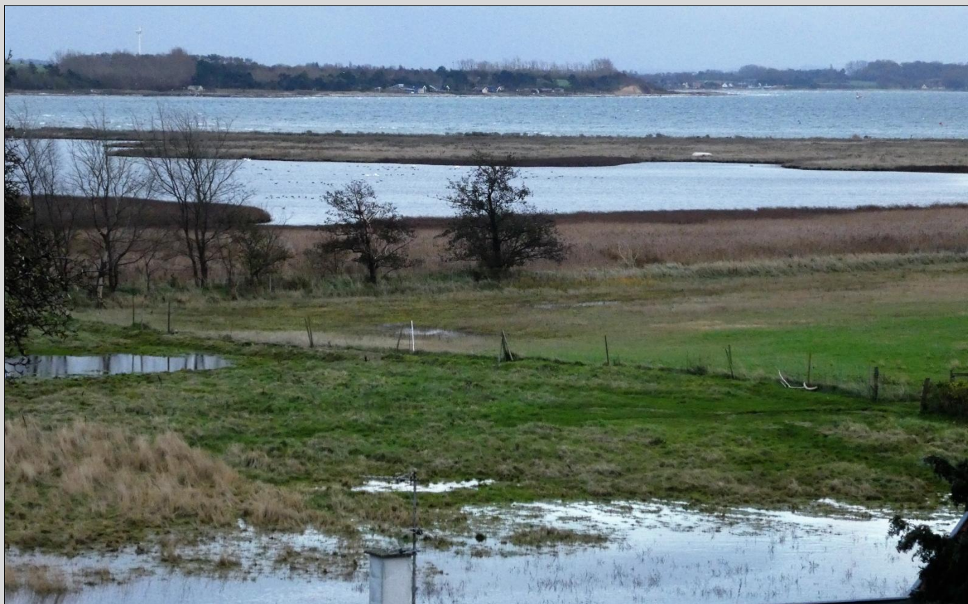
Udsigt fra kirken og det sumpede område Vejlen.