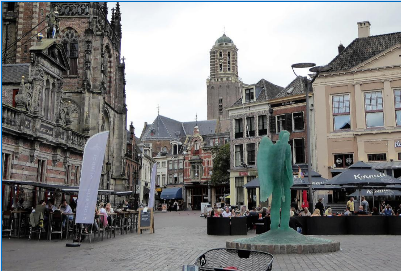
2 x torvet i Zwolle. En skulptur af en transparent engel vogter over pladsen.