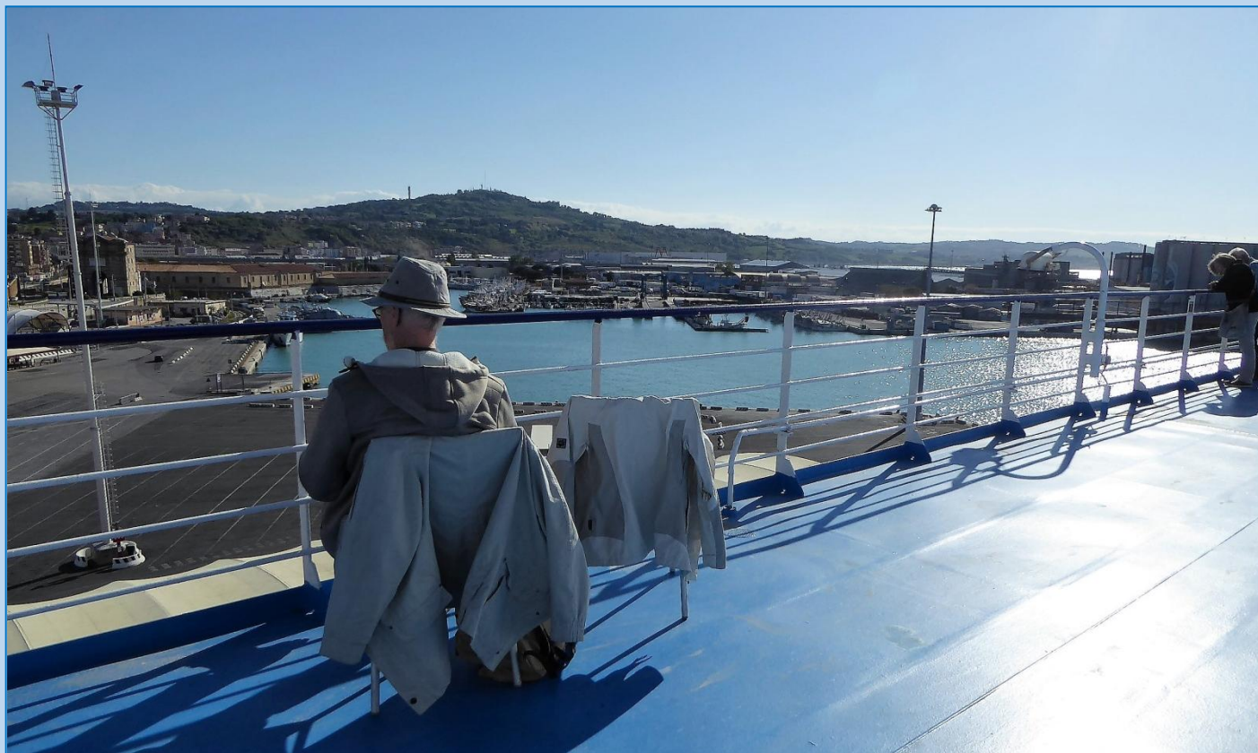
Vi lægger fra. Ancona forsvinder og det gode vejr er kommet.

Så bliver det opdagelsernes tid. To etager op på dækket, forbi restaurant, selv-service, spillehal, legerum, opholdsarealer, lounges og til sidst er vi ude i det fri, hvor der også er pænt med mennesker. Man føler sig som på 20. etage i et højhus, når man kigger ned på havneområdet. Ancona breder sig for foden af et bakkedrag, husene kravler opad, ikke helt uspændende. Og så sejler vi. Vi er på vej til Hellas !