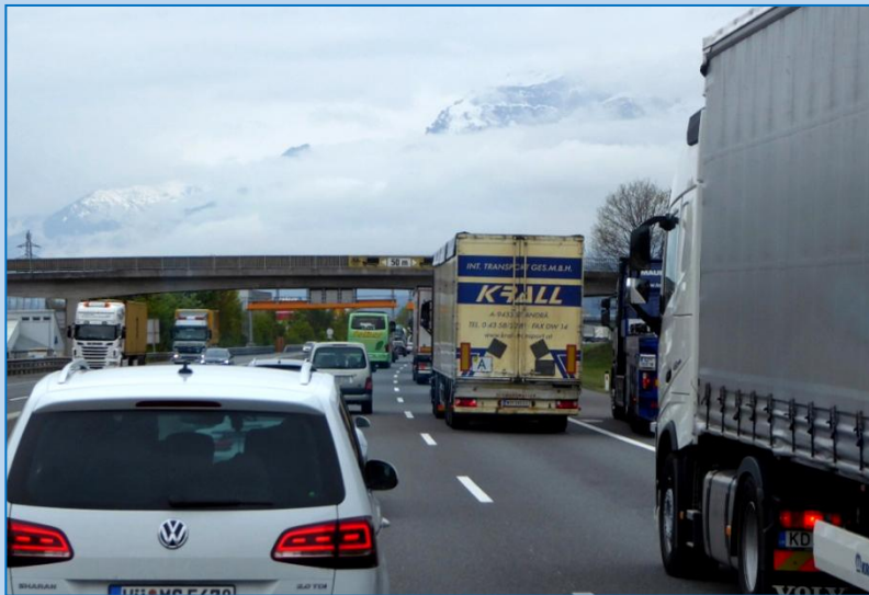
← Tæt trafik og halvdårligt vejr gennem Østrig

Lørdag, den 22.4.2017 starter vi fra Roskilde mod Berlin , derfra fortsætter vi til Greiz . Begge gange er det familiebesøg. Derefter stiler vi mod en stellplads ved Bad Aibling syd for München. Nu begynder vores eventyr for alvor.