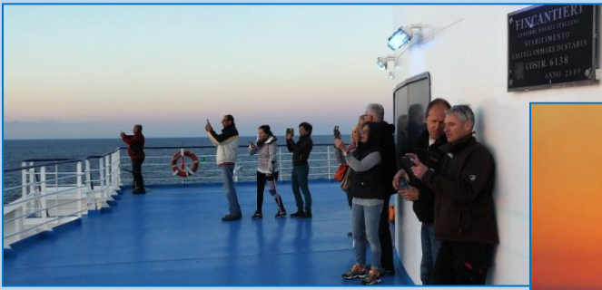
Solnedgangen er et tilløbsstykke