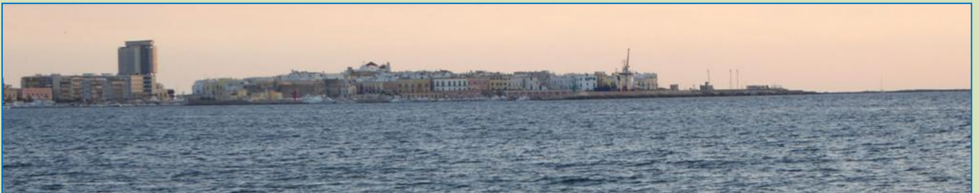
Gallipoli og solnedgang fra campingpladsens strand.

Nu er vi nået til en campingplads i Gallipoli. Der er 3 km ind til Centro Storico , der ligger på en slags ø ud for den moderne bydel. Selve pladsen her er så som så, men vi har besluttet at blive her i 2 nætter. Vi når også en solnedgangstur ned til vandet, hvortil der fører en fodgængertunnel direkte fra campingpladsen. Gallipoli-halvøens skyline afslutter horisonten på venstre hånd og ser spændende ud.