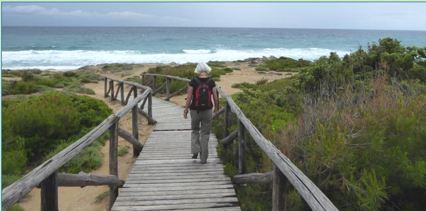
Frokostpause undervejs. Vi skal lige kigge ned til det oprørte hav.

Køredag med gråvejr til at begynde med, men dog heldigvis ikke det massive regnvejr, som vejrudsigten på internettet havde varslet om. Vi vælger igen en rute langs kysten og følger den næsten helt til Táranto . Således oplever vi smukke strækninger langs vandet, der skifter i retning mod blå farve, i takt med at himlen bliver mere og mere skyfrit. Men efter Táranto trækker der igen mørke skyer op, og da vi ankommer til Metaponto , dagens mål, regner det tungt. Hvad værre er: vi kan ikke finde stellpladsen, der er noget galt med koordinaterne. Vi kører og kører rundt og havner to gange det samme sted ude ved vandet på en pløret parkeringsplads. En autocamper fra Tjekkiet følger os rådvildt. Da der dukker en mand op spørger jeg på mit bedste italiensk, hvor denne her area sosta camper (= "stellplads" på italiensk) befinder sig. Kommunikationen ender med, at han kører foran i sin bil og gelejder os hen til stedet - faktisk lige omkring det første gadehjørne. Stellpladsen er stor og nærmest forladt. Ud over os er der en anden autocamper. Pga. vejret virker her noget trist.