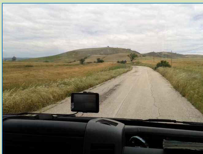
Landskab undervejs →

Til sidst sætter vi GPS'en til Matera . Nu bliver landskabet lidt mere kuperet med vide, bløde bakker, der skyder sig ind foran hinanden – kornmarker, græsmarker, øde, åbne horisonter. Udkantsagtigt.