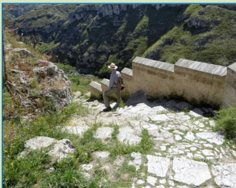
Først går det ned til den lille å i bunden. En lang, smal og gyngende hængebro fører hen over den. Og så er det jo op igen. Matera klamrer sig så at sige til klipperne oven over.

En smuk og spændende dag! Igen tager vi bussen kl. 9.30 op til byen, dengang med hver sin rygsæk og godt med vand, og så marcherer vi løs. Vandringen går først – næsten alpint - i stejle og knudrede serpentiner nedad, så over en lang, gyngende hængebro og derfra stejlt opad igen. Og ja, det passer: storslået udsigt ud over Matera, og herfra kan man også tydeligt se det tilsyneladende forladte huleområde, hvor der tidligere boede folk, men som man i 50'erne som led i et genhusningsprojekt flyttede til nyere og bedre boliger i en anden del af byen. Hvorefter man fandt ud af stedets turistiske attraktionsværdi, bevarede og sanerede det, og nu er det optaget på UNESCOs liste over verdenskulturarv.