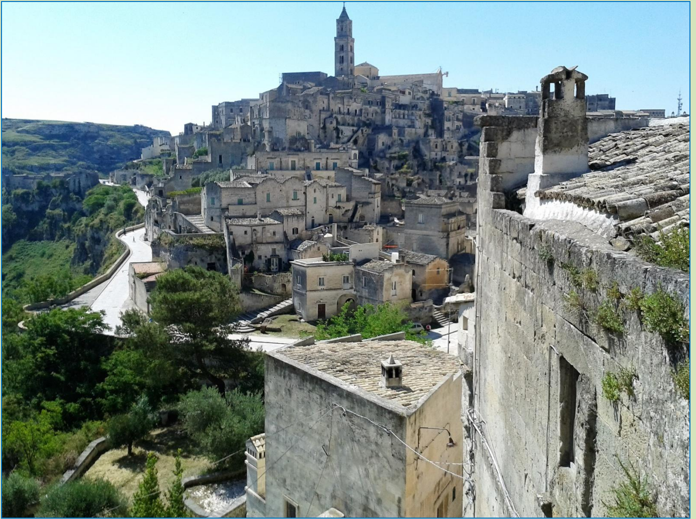
Matera. Det første vue ud over den gamle bydel. Er der noget at sige til, at man mister mælet det første øjeblik? Gaderne består mestendels af trapper op eller ned, dog fører en (vist nok bilfri) ringvej uden stigninger udenom. Den kan lige skimtes til venstre.