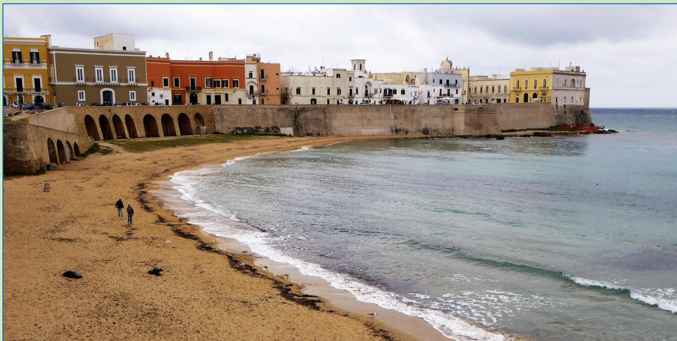
Gallipolis postkortmotiv til den ene side ↑ og til modsat side ↓.

de store seværdigheder, men fyldt med bittesmå gyder og en ægte fiskerihavn med mange kulørte småbåde. Endda en slags værft findes her, hvor der arbejdes intensivt med reparationer. Det hele virker autentisk og ikke særligt turistet. Den eneste kunsthistoriske perle er domkirken, der kun består af facade, da kirken udgør en del af den sammenbyggede gadefront og således ikke er en separat enhed. Facaden minder om facaderne i Lecce: gylden tufsten og rigt ornamenteret barok og flot.