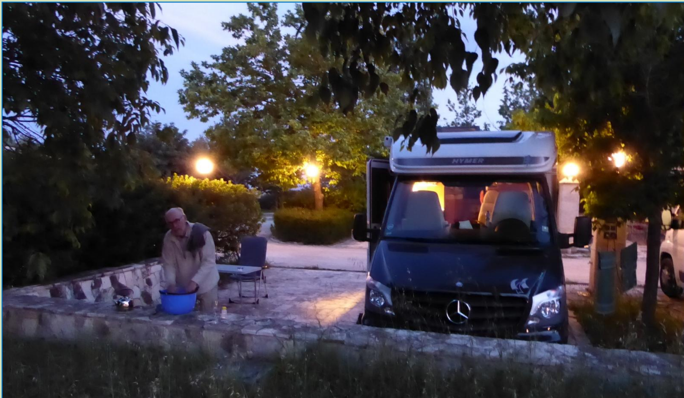
Opvask på parcellen.

Vi beslutter at blive en dag mere for at gå en tur i klippeområdet over for byen. Der ser meget spændende ud. Desuden trænger vi at handle for at fylde lagrene op igen. I dag, søndag, var der ingen åbne alimentari .