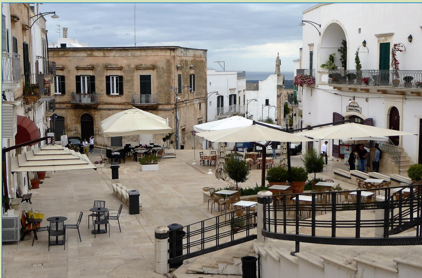
Det i og for sig hyggelige torv i Ostuni med Adriaterhavet i baggrunden. Vejret er i øjeblikket ikke til udendørshygge. Alle venter på solskin.

Nu har vi lyst til et par overliggerdage. I ACSI-bogen finder vi en campingplads ude ved kysten i Specchiolla , en slags badeby. Byen befinder sig dog stadig i vintersøvn og virker halvdød, må vi konstatere efter en kort cykeltur. Vi beslutter derfor at fortsætte vores færd i morgen. Synd, fordi campingpladsen virker egentlig tiltalende, og der er da også en del campister. Men for os er det ikke nok, der bør i hvert fald være noget at se på.