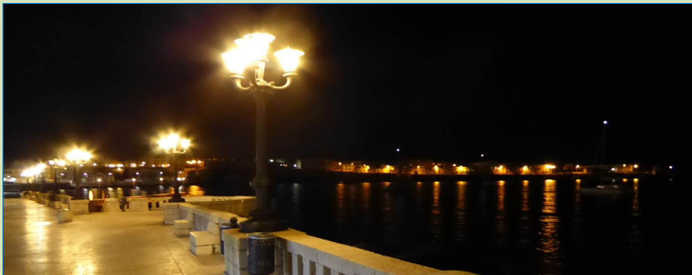
Ótranto og Adriaterhavet.

stadigvæk, børn løber rundt og leger, natteluft er mildt og dufter af middelhav, månen hænger fuldt og rundt på den sorte nattehimmel. Vi glæder os til i morgen, hvor vi skal opleve det hele ved dagslys.