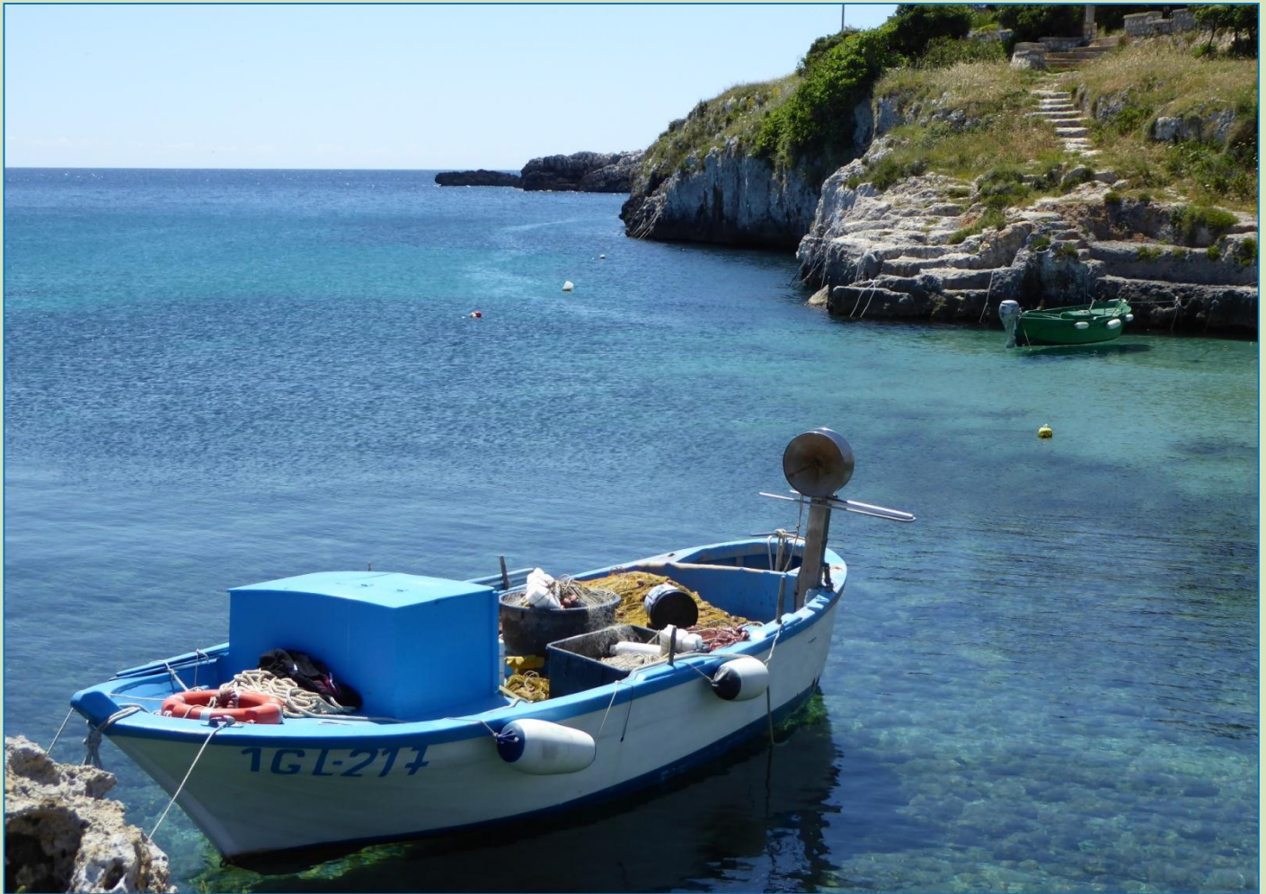
Steder undervejs. Vandet er uforskammet blåt og klart. Læg mærke til båden i baggrunden: det nærmest svæver i luften!

Nu er vi nået til en campingplads i Gallipoli. Der er 3 km ind til Centro Storico , der ligger på en slags ø ud for den moderne bydel. Selve pladsen her er så som så, men vi har besluttet at blive her i 2 nætter. Vi når også en solnedgangstur ned til vandet, hvortil der fører en fodgængertunnel direkte fra campingpladsen. Gallipoli-halvøens skyline afslutter horisonten på venstre hånd og ser spændende ud.