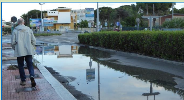
Den regnvåde Metaponto by ↑ og en tur langs stranden, der venter på sommervarmen (det gør vi også) →

Køredag med gråvejr til at begynde med, men dog heldigvis ikke det massive regnvejr, som vejrudsigten på internettet havde varslet om. Vi vælger igen en rute langs kysten og følger den næsten helt til Táranto . Således oplever vi smukke strækninger langs vandet, der skifter i retning mod blå farve, i takt med at himlen bliver mere og mere skyfrit. Men efter Táranto trækker der igen mørke skyer op, og da vi ankommer til Metaponto , dagens mål, regner det tungt. Hvad værre er: vi kan ikke finde stellpladsen, der er noget galt med koordinaterne. Vi kører og kører rundt og havner to gange det samme sted ude ved vandet på en pløret parkeringsplads. En autocamper fra Tjekkiet følger os rådvildt. Da der dukker en mand op spørger jeg på mit bedste italiensk, hvor denne her area sosta camper (= "stellplads" på italiensk) befinder sig. Kommunikationen ender med, at han kører foran i sin bil og gelejder os hen til stedet - faktisk lige omkring det første gadehjørne. Stellpladsen er stor og nærmest forladt. Ud over os er der en anden autocamper. Pga. vejret virker her noget trist.