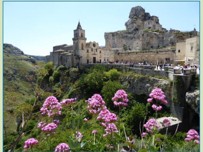
Trapper og udsigter, bl.a. ned over slugten, der adskiller Matera fra en bakketop overfor. Vi kan se både på kortet og i virkeligheden, at der fører en vandresti ned til den lille å, der klukker afsted i bunden af slugten, og op på den anden side, hvorfra man sikkert har en forrygende udsigt over mod Matera. Dér skal vi hen i morgen!

Vi tilbringer 4 timer på gåben. Varmen er tiltagende, solen stråler fra en skyfri himmel, og alt er såre kønt. Da vi venter på bussen, der skal komme kl. 13, søger vi (og de andre ventende) ind i skyggen. Inden da har vi lige fundet en åben bager og køber 4 panini – de første i Italien, der ikke er luft og til gengæld meget lækre.