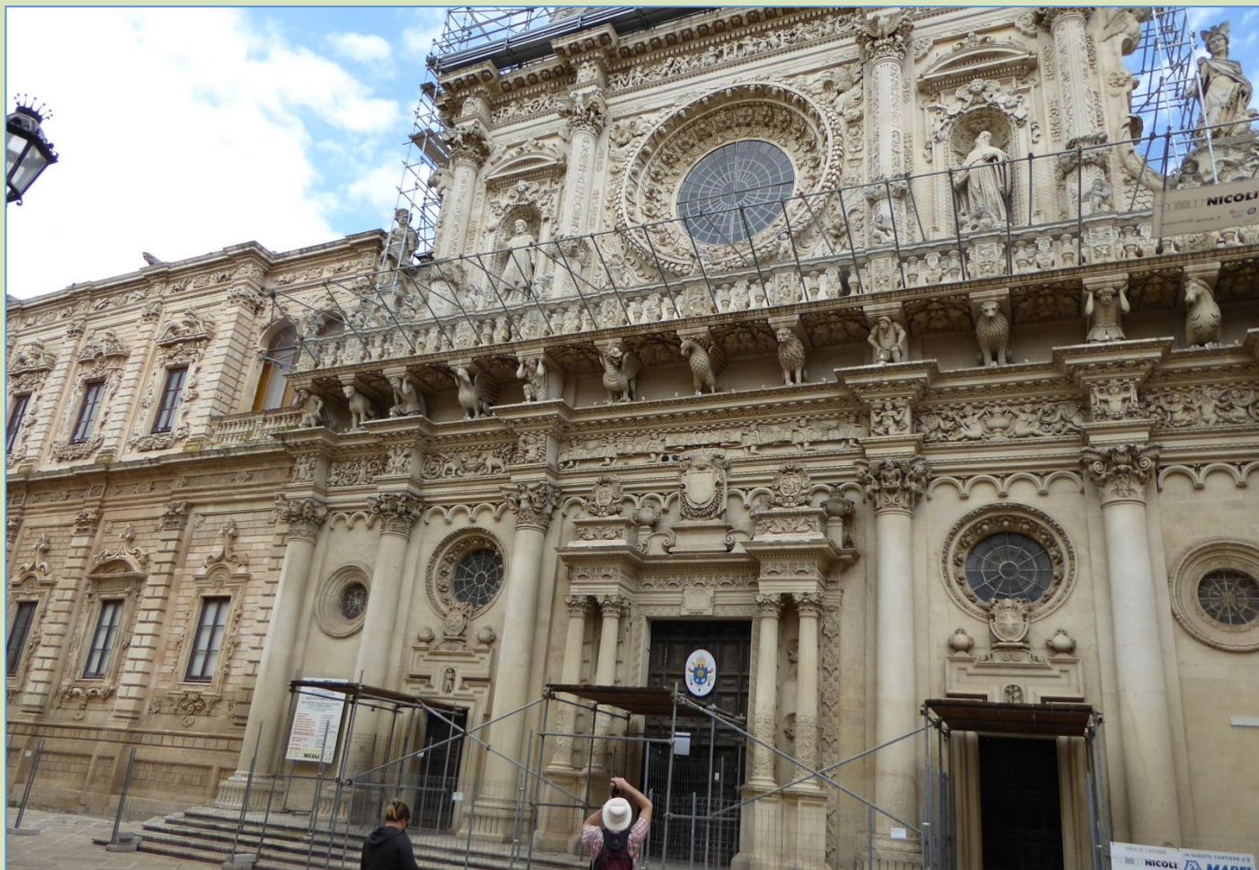
Lecce's pragtstykke, basilika Santa Croce. Desværre lukket pga. restaureringsarbejde.

kryber vi sammen under parasollen, indtil vi har spist færdig. På et apotek køber vi nogle smertestillende piller – de medbragte har jeg brugt op pga. mine smertende ribben – og hos supermarkedet Conad dækker vi os ind med de varer, vi mangler. Og så går det tilbage til Franz, der står dér lige så nydeligt og venter på os.