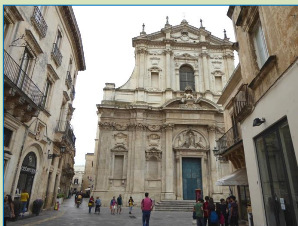
(Pinse)mandag, 16. maj 2016: Fra Specchiolla til Lecce og Òtranto

Videre mod Lecce , som overrasker med et væld af kirker i sofistikeret rokoko/barok-stil og i gyldne farver, der er helt overvældende. Dens tilnavn "Sydens Firenze" bærer den med rette. Ud over kirkerne er der også resterne af et romersk amfiteater, så der er noget at se på. Sightseeing gør sulten, vi finder derfor et pizzeria i en lille, afsides beliggende sidegade, hvor der også kommer de lokale. Da det begynder at dryppe,