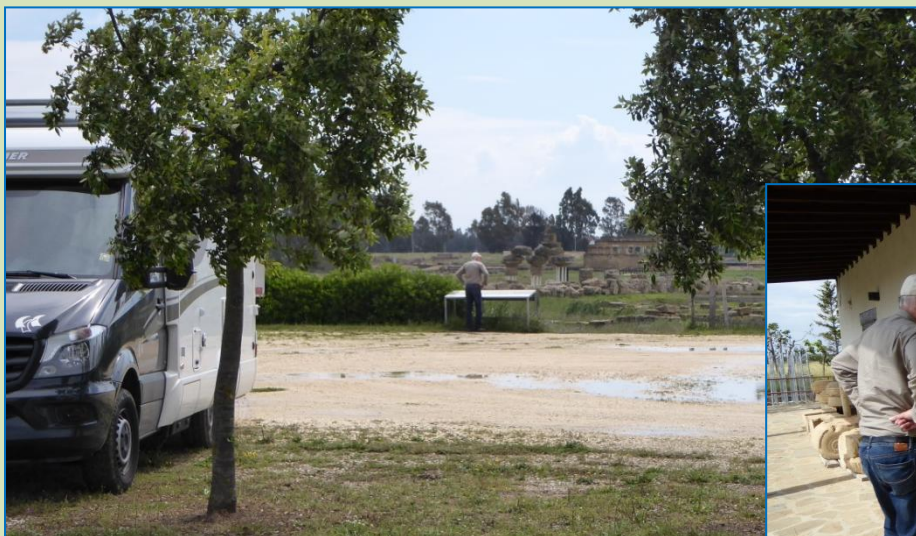
Græske udgravninger og søjlerester. Er man arkæologisk interesseret, så er der meget at se på og opleve. Selv når vejret ikke er helt i top.

mod det Arkæologiske Museum og et Hera tempel. Tempelresterne finder vi nemt, de kan ses fra vejen, og det Arkæologiske Museum har vi for det meste har for os selv og kan i ro og mag studere alle de flotte græske krukker og andre genstande fra omkring år 600 f.Kr.