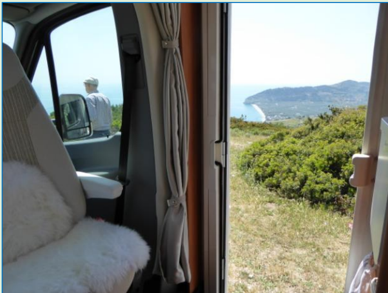
Frokostpause med udsigt

Vi kommer først af sted omkring 11-tiden, fordi hastværk som bekendt er lastværk, især for pensionister. Det er meningen at følge kystvejen i retning mod Mattinata og derfra køre op til Monte Sant'Angelo , men kystvejen misser vi og følger derfor vejen op gennem Foreste Umbra , et tæt skovområde af gamle egetræer med lejlighedsvis panorama-kig ud over bjerge eller ned mod kysten.