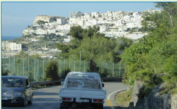
←Vi nærmer os Vieste, en hvid by, der klumper sig sammen omkring en spore ud til Middelhavet. I romertiden hørte denne del af Syditalien til "Magna Graecia", og det er derfor, byerne minder om dem man kender fra Grækenland.

I dag, lørdag, er vi så nået frem til Apulien, turens egentlige mål. Vi begynder med Vieste på Gargano-halvøen. Den sidste del af strækningen hertil er Franz' ilddåb: op og ned ad hårnålesving og meget smalle bjergveje, men heldigvis næsten ingen trafik.