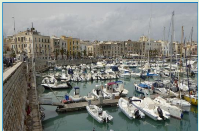
Trani-impresioner: den kunsthistorisk interessante katedral↑, hvor der i begyndende regnvejr ventes på brudeparret↑↑, og havnefronten.

Efter endt bytur bliver det en Hymer-frokost om bord, inden vi kører videre mod den ovenfor omtalte stellplads neden for Castel del Monte . Man kan vist ikke sige, at den er overfyldt; tværtom. Senere kommer der en camper mere, så er vi da ikke alene.