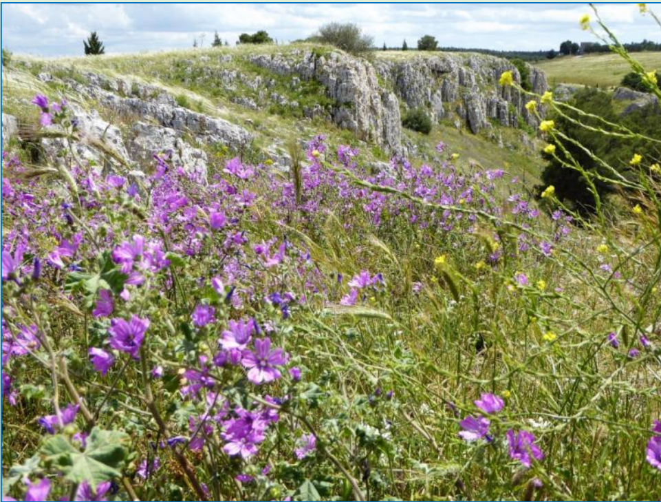
Et frokoststed undervejs: Blomsterhav og smukke udsigter

Efter en nat på stellplads og en lav vandbeholdning stiler vi nu mod en campingplads. Det bliver "dei Trulli" (ACSI), der ligger i cykelafstand til byen. Men at finde frem til den!! Det tager lang tid, inden vi er på rette spor, vi drejer mange forgæves runder, fordi både GPS'en og vi bliver temmelig forvirrede over de mange lukkede veje og forbudsskilte, især rettet mod autocampere.