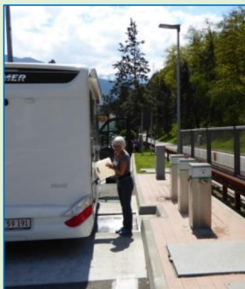
← Tømnings- og påfyldningsfaciliteter i Sydtyrol

Lige efter Brennerpasset ser vi, at der på en rasteplass skiltes med camperservice. Det skal vi da prøve! Og sandelig, her er både til tømning og påfyldning af vand, viser det sig. Senere opdager vi, at der ved mange tank-stationer i hele Italien findes lignende servicefaciliteter for autocampere. Der kan man bare se.