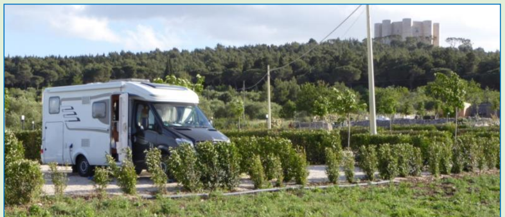
Stellpladsen tæt på Castellet

Nu står vi her på en (campingpladsagtig) stellplads næsten lige neden for Castel del Monte , stauferkejser Frederik IIs mysterieomgærdede ottekantede middelalderbygning fra 1200-tallet og UNESCO verdenskulturarv, der majestætisk knejser over os på en pinjeklædt bakketop. Stellpladsen er tilknyttet en "Azienda" med restaurant, og alt er meget velholdt og stilig men åbenbart stadig i sin vorden. Her er hverken vand eller tømningsfaciliteter, selv om de iflg. stellpladsguiden altså skulle være der. Derfor var vi også lidt skødesløse med vores vandforbrug med det resultat, at vandbeholdningen nærmer sig bunden. Men ingen vandhane her, så jeg køber i baren et par dyre 1½ liters flasker drikkevand for al tilfældets skyld.