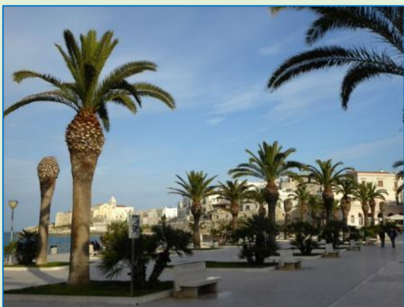
Impressioner fra Vieste. Det er en dejlig by, ikke for stor, ikke for lille, i rimelig gåafstand fra campingpladsen. Smukt beliggende på den kuperede Gargano-halvø med stejle klipper og bjergtagende landskaber.

Igen går dagen med at dase, læse osv. Indtil kl. 16, hvor vi tager os sammen og cykler ind til byen for lidt mere udførlig sightseeing. Vieste ligger på en bakket spore ud til havet. Øverst oppe er et castello (militært område), for foden af det katedralen, der er flot pyntet i anledning af helligdagen og processionen, der senere i aften skal vende tilbage med statuen af jomfru Maria (iflg. vores naboer).