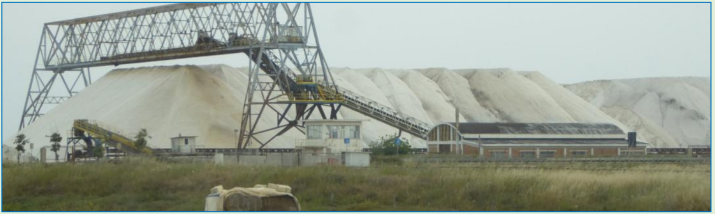
Salt, salt, salt - det er ikke til at forstå, at det på et senere tidspunkt lander rent og kridhvidt på køkkenbordet.

Trani, som skulle være seværdigt, har heller ingen campingplads. Den finder vi så ved den lille badeby Bisceglie . Koordinaterne til den opgivne ACSI-adresse er forkerte, vi krydser lidt hvileløst frem og tilbage i ingenmandsland. Til sidst får vi øje på en ældre herre i vejkanthen, der fægter vildt med armene og gør tydeligt, hvordan vi når frem til campingpladsen. Som er et sympatisk stykke indhegning med gamle oliventræer og derfor også hedder "degli ulivi", og hvor vi får en venlig velkomst. Her er hyggeligt at være. Vejret er imidlertid – og har været det hele dagen – noget