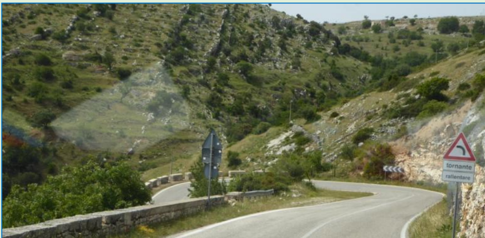
Da vi er oppe går det nu nedad, og det mangler ikke på hårnålesving. Men landskabet er øde og trafikken ikke noget at tale om.

Tilbage til Franz og overvejelserne om, hvordan man kommer ud igen fra parkeringspladsen og gennem bommen. Der er stadig ikke et øje på restauranten, dog dukker der pludselig en mand op, der vist nok spørger, om han kan hjælpe. Det kan han, og jeg forstår, at parkeringspoletten (med hvilken man kan åbne bommen) kan fås i restauranten på den anden side af vejen. Det lykkes formodt 5 Euro, hvorefter vi lettet spiser en hyggelig Hymerfrokost, inden vi åbner bommen med mønten og kører derud ad over land mod Trani .