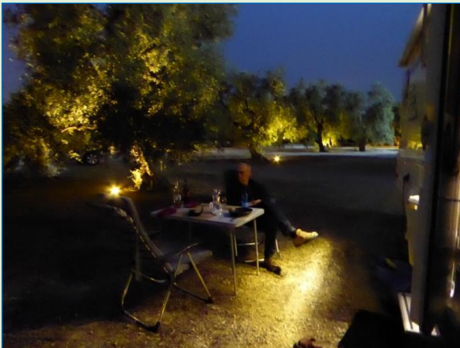
Mørket er faldet på og belysningen er tændt. Spots'ene er nedfældet i jorden og stråler opad, som giver en absolut "speciel effekt".

Da mørket falder på tændes pladsens belysning. Det er et tæppe af små spots nedfældet i jorden, som lyser opad gennem de gamle oliventræers glitrende løv. Campingpladsen ligner eventyrland med den smukkeste campingplads-belysning, vi længe har set.