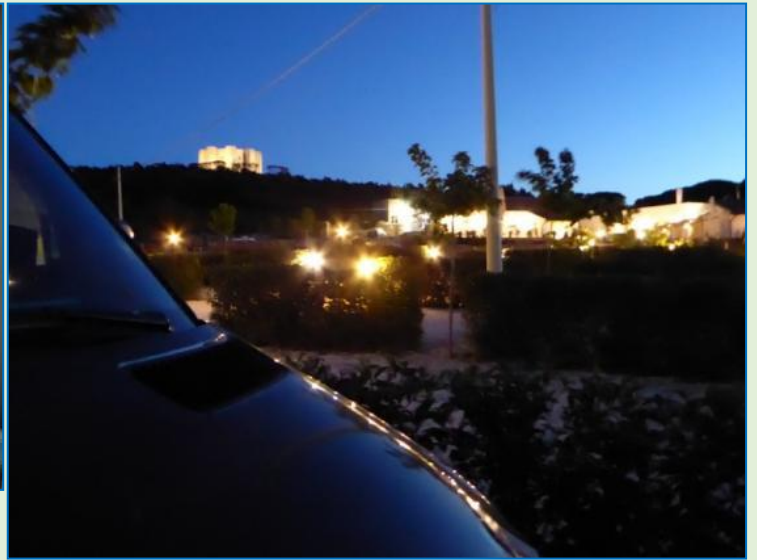
Castel del Monte gennem stuevinduet og efter mørkets frembrud. De andre belyste bygninger er Azienda'ens.

Dagen bød ellers på sightseeing i Trani , en by med to stjerner pga. den romanske katedral og borgen. Flotte er begge dele, om end kirken pga. et bryllup var lukket, og kastellet afstår vi fra, idet vi bliver overrasket af en kraftig regnskylle, som også bevirker, at bryllupsselskabet forføjer sig hurtigt, efter at brudeparret er trådt ud af kirken. Vi har sat bilen et stykke fra den gamle bydel ved havnen – for en sikkerheds skyld bag lås og slå. En stellplads længere inde kan vi ikke finde, selv om der skulle være en. Den er muligvis optaget af personbiler.