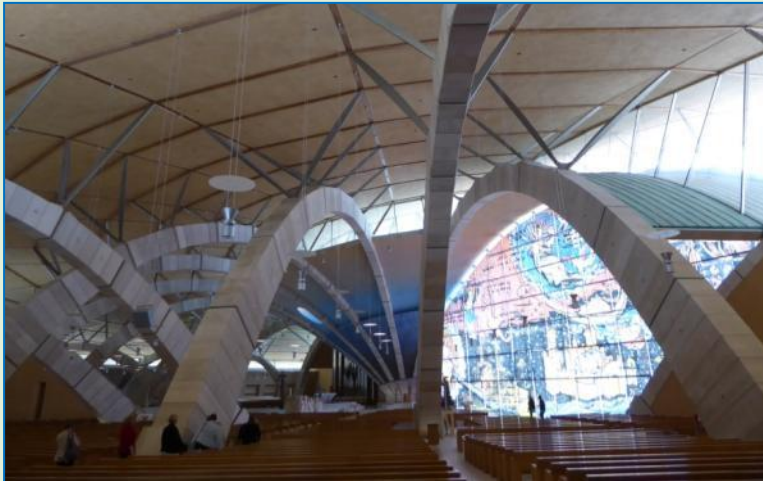
Dette er det indre af en kirke og minder ganske svagt om en edderkop. Meget imponerende.

Gråvej og kraftige momentane regnskyl, der drøner øredøvende på camperens tag. Vi afventer indenfor, og omkring kl. 11 ser det ud til at være opholdsvej nok til at besigtige pilgrimsområdet. Det bliver med camperen, en cykeltur frister ikke; vejen er for lang og især for stejl. GPS'en finder en næsten tom parkeringsplads med autocamper-symbolet bag en bom, der åbner og lukker automatisk efter os. Men hov, hvordan kommer vi ud igen? Pladsens tilliggende restaurant, hvor man iflg. opslaget kan købe en parkeringsmønt, er lukket. Nå, den tid den sorg, siger Gert. Vi begiver os på vej til den efter Padre Pio opkalde berømte kirke, tegnet 2004 af stjernearkitekten Renzo Piano. Kirken kan rumme 7000 pilgrimme, mens området foran kirken har 70.000 ståpladser!