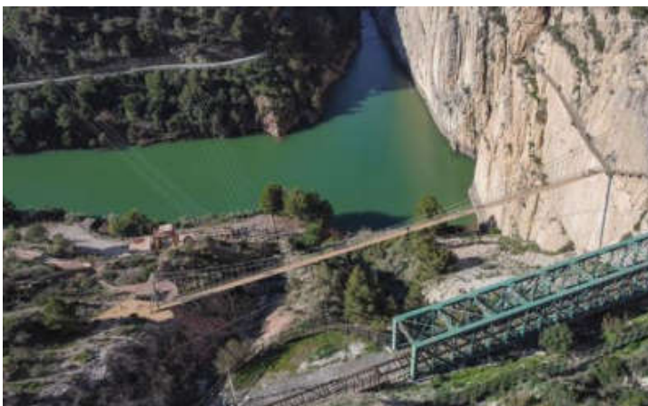
Captura hængebroen bliver en luftig oplevelse. Her er det tegnet ind i billedet – under broen med skinner.

De små landsbyer omkring Caminito del Rey, såsom Antequera, Álora, Ardales og Valle de Abdalajís, har oplevet en betydelig vækst i turisme og økonomisk aktivitet. Der er blandt andet etableret flere campingpladser i området.