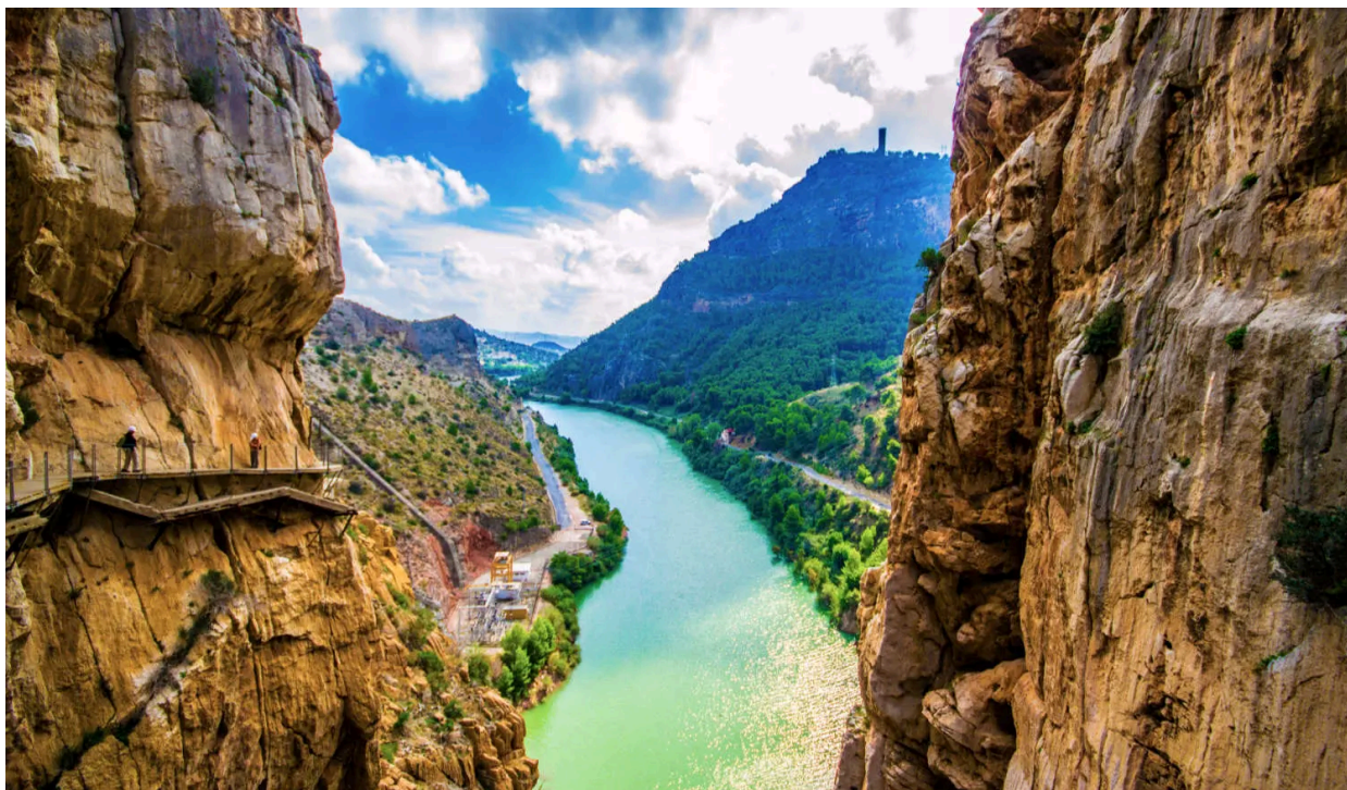
Udsigten er spektakulær langs Caminito del Rey.

Denne spektakulære gangsti ligger i Málaga-provinsen i Andalusien, Spanien, og er blevet en populær destination for eventyrlystne turister fra hele verden.