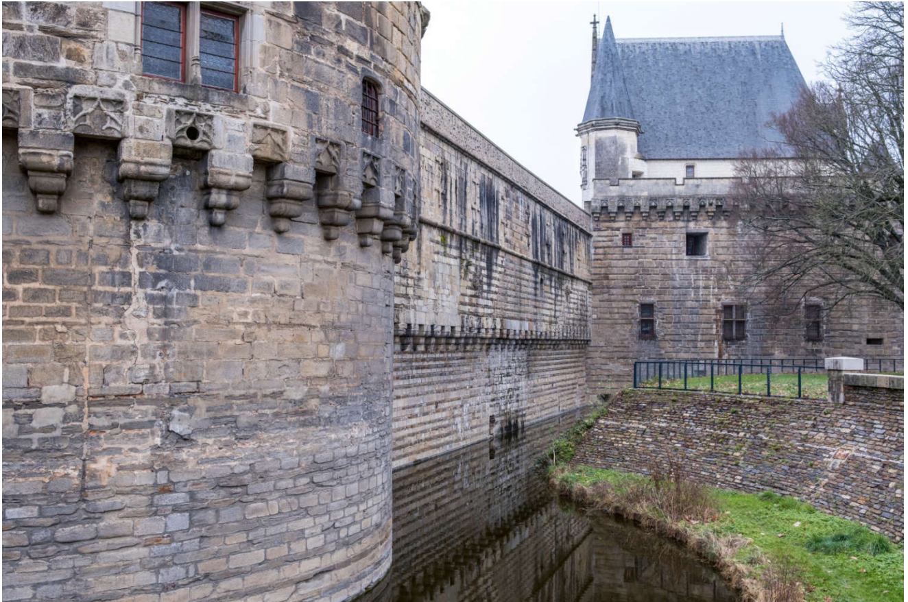
Det er ingen grunn til å ta raskeste vei når kysten langs Atlanterhavet har så mye å by på. Her festningen i Nantes.

Tanken oppsto mer eller mindre spontant, og dette krevde en del organisering. For etter et langt liv har vi alle ganske mye i skuffer, skap, loft og kjellere, men det løste seg til slutt ganske bra og bobilen ble klar for å bli et midlertidig hjem.