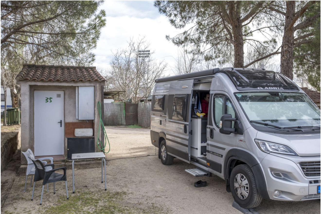
Private sanitæranlegg på hvert plass. Enkelt, men rent og bare for oss.

Campingplassen tilbyr private sanitæranlegg på hver plass til gjestene. Kun det grunnleggende, servant, dusj og toalett, men alt var rent og «ditt». Selv ble vi i tre netter for å besøke byen, jobbe litt og vaske i bilen.