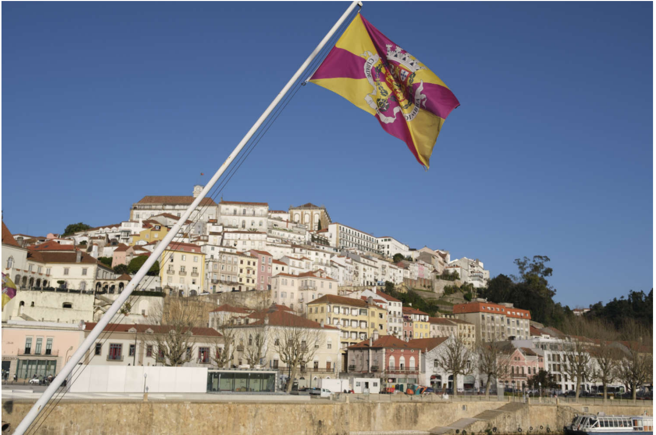
Byen Coimbra, i hjertet av Portugal.

Vi fikk se og oppleve vakre byer, vakkert landskap, og etter hvert fikk vi også hyggelige værforhold.