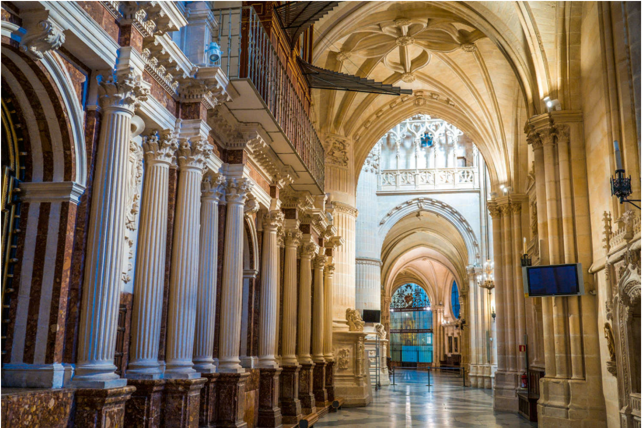
Katedralen i Burgos er fantastisk vakker.

Allerede på utsiden kunne vi se at dette er en spesiell bygning, og på innsiden fikk vi oppleve et vakkert og imponerende museum. Dessverre var det enda ikke blitt varmere i været, og faktisk var det blitt kaldere da vi kom til Burgos.