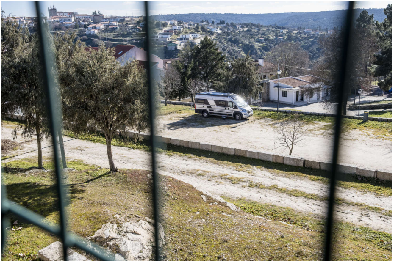
Vi er de eneste gjestene på campingplassen i Miranda do Douro.

Etter at gudstjenesten var over, gikk vi inn for å studere kirken før vi vendte tilbake til campingplassen. Vi kjørte så videre vestover, og krysset igjen grensa over til Spania, for så å komme inn i Portugal igjen litt senere.