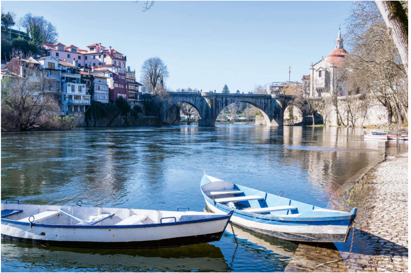
I Amarante er São Gonçalo-broen et høydepunkt.

Vi startet om ettermiddagen på «innfartsveien» til Gamlebyen. Den vakre São Gonçalo-broen, som ble bygget av romerne for å forbinde byen med Braga og Guimarães, men ødelagt under flom i 1763.