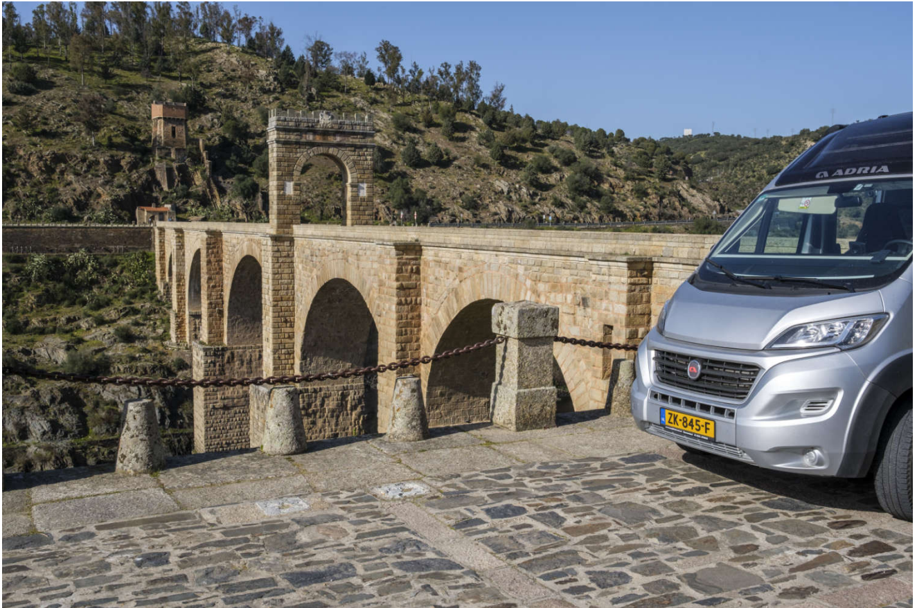
Den romerske broen i Alcántara ble bygget mellom 104 og 106 e.Kr. under keiser Trajan.