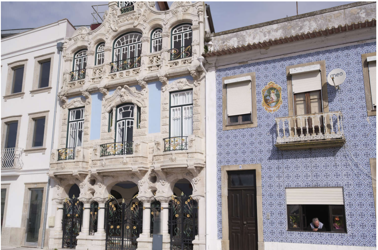
Nydelige fasader i Aveiro.

Det angrer vi ikke på. Her fikk vi se delfiner hoppe, og vi fikk et fargerikt stopp i Aveiro, som er «Portugals Venezia».