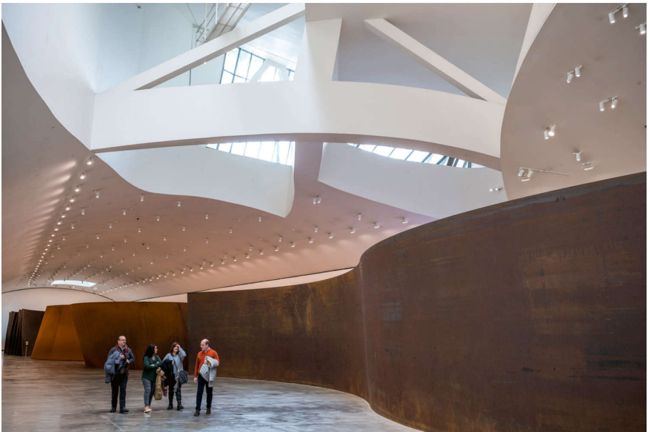
I Guggenheim-museet venter mange overraskelser.