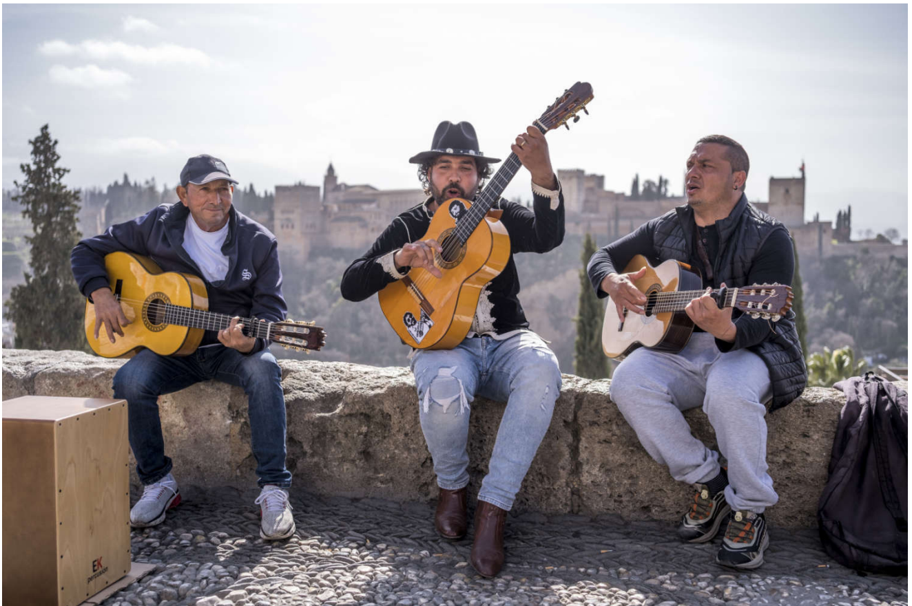
Spania er også musikk. Med Alhambra i Granada i bakgrunnen.

Jeg prøvde å telle antall oliventrær på veien, men det ble for komplisert med kilometervis av oliventrær til høyre og venstre for veien.