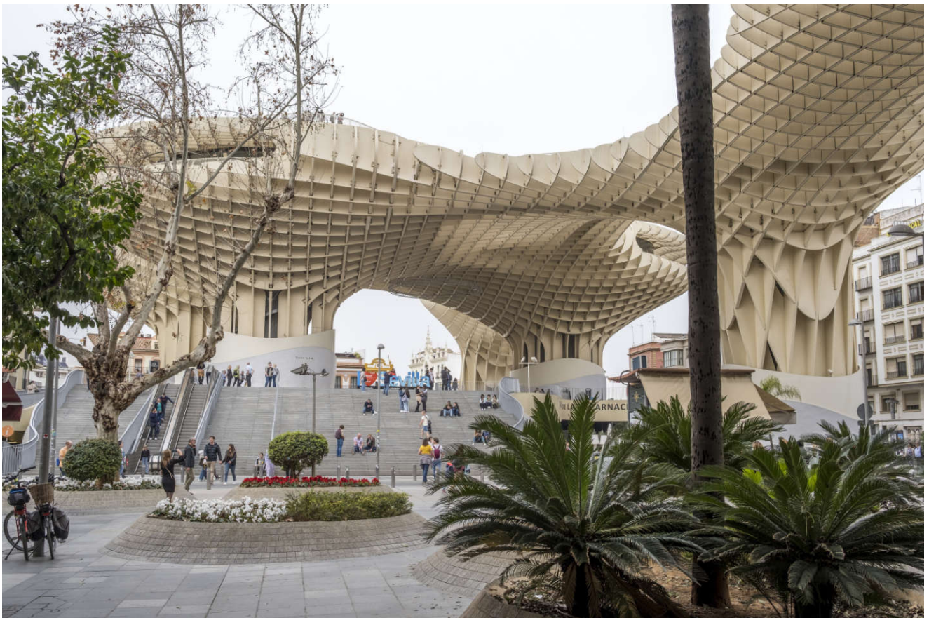
Metropol Parasol er en imponerende trekonstruksjon.