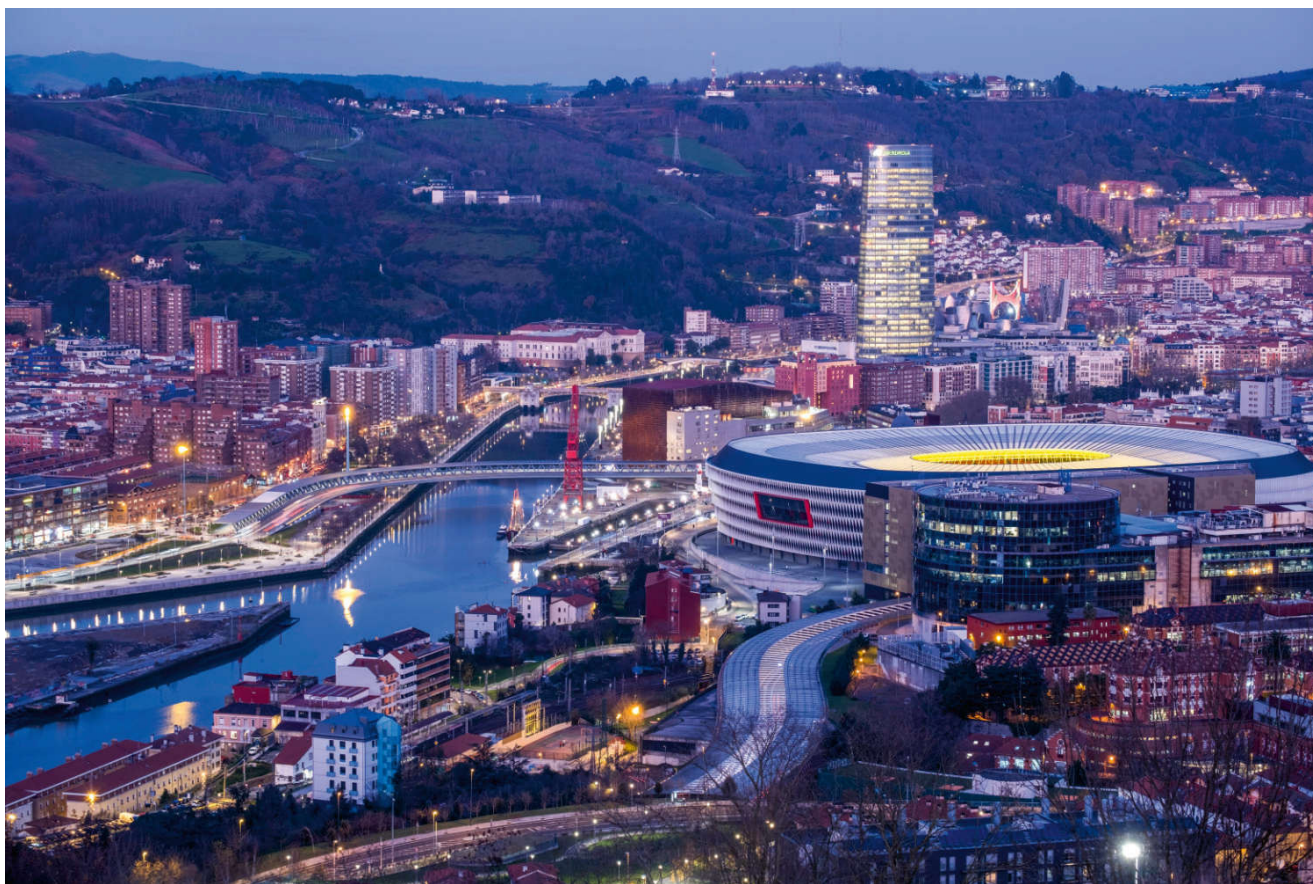
Utsikten fra bobilplassen i Bilbao er en fryd for øyet om dagen, men enda flottere om natten.

På ønskelisten vår her sto selvfølgelig Guggenheim-museet i Bilbao, og fra den fine bobilplassen som ligger høyt over byen får man en fantastisk utsikt både om dagen og spesielt om natten.