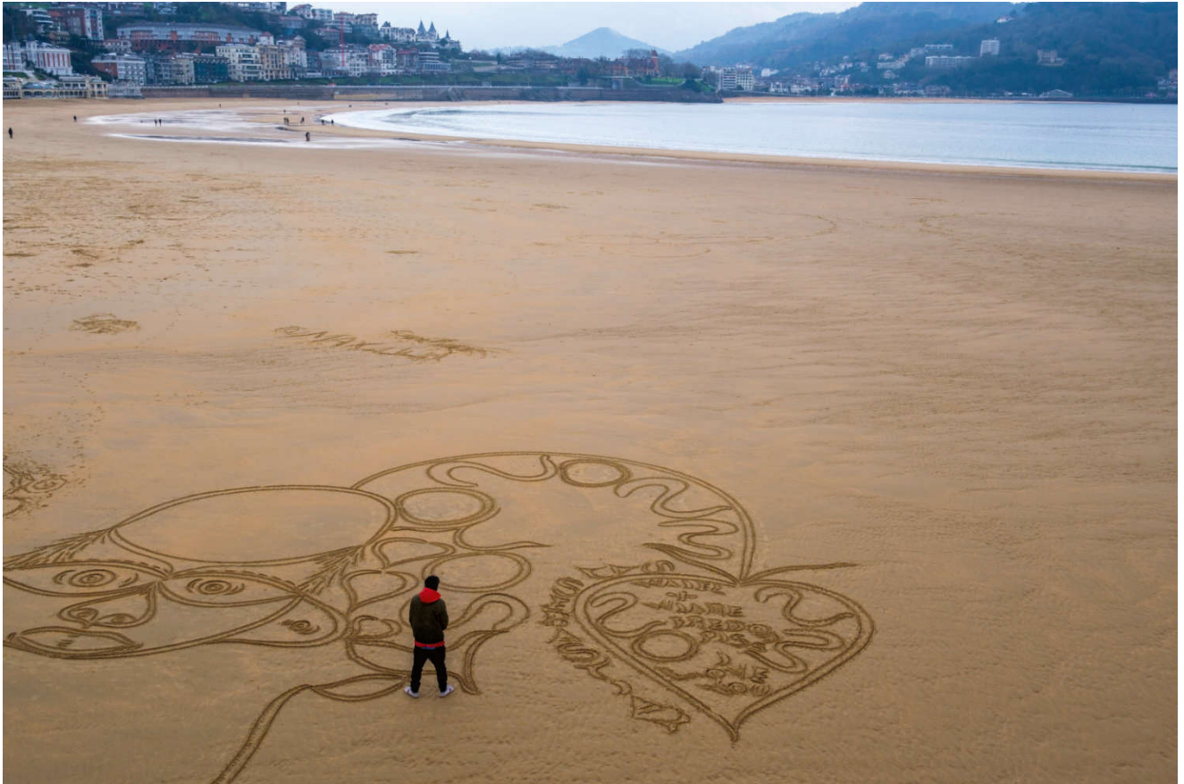
Roen på vinterstranden i San Sebastián byr på mange muligheter.