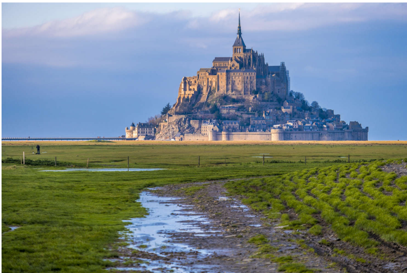
Mont Saint Michel er verd en omvei i seg selv.

For 10-12 euro per natt får du det bra, og på de fleste steder sanitæranlegg, strøm (6 Amp) og alltid fast dekke. På appen kan du se hvor plassene er, hvordan du kommer deg dit og om det fortsatt er ledige plasser.