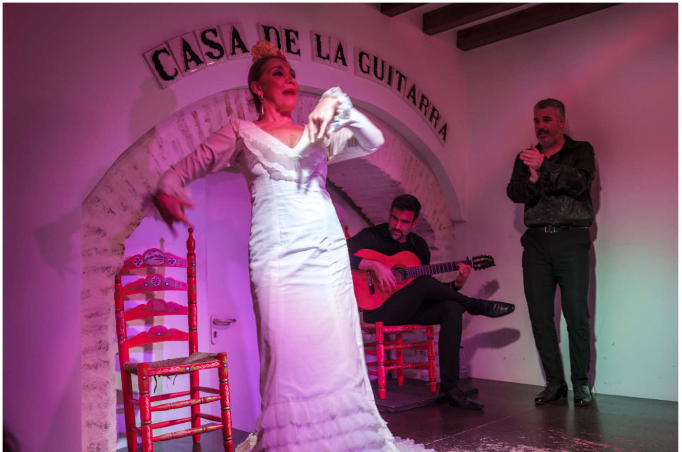
En liten, intim flamencokonsert full av lidenskap og ild.