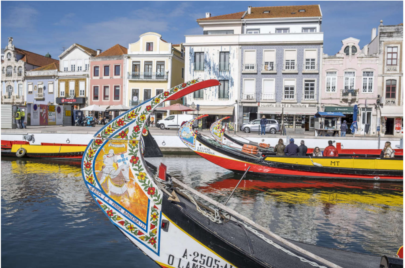
Fargerike båter i Aveiro, «Portugals Venezia». Skipperne prøver å få alle forbigående til å bli med på et cruise.

Her tok vi en ny spasertur på stranden, og kunne beundre fargerike fasader på gamle fiskerhus. Underveis ble vi også tipset av andre bobilcampere om stedet Coimbra, som viste seg å være en vakker og høytliggende gammel by.