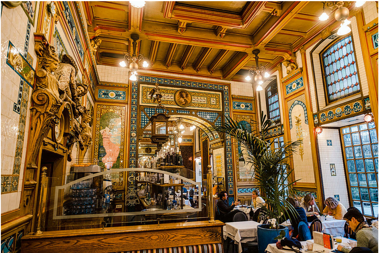
La Cigale i Nantes er et fantastisk eksempel på jugendstil og åpnet i 1895. Og har vært praktisk talt uendret siden den gang.

sanitæranlegg og til og med et oppvarmet svømmebasseng. Og rundt oss kunne vi kose oss til lyder fra nøtteskrike, rødstrupe og om natten kattugle. (Ved siden av har Caravan-car Park en rimeligere bobilplass. Red. anm.)