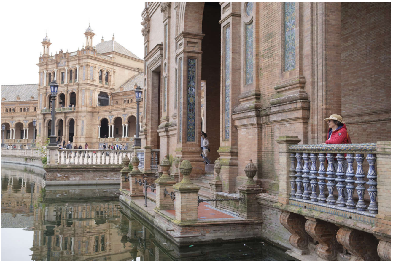
Sevillas palasser er av enestående skjønnhet.