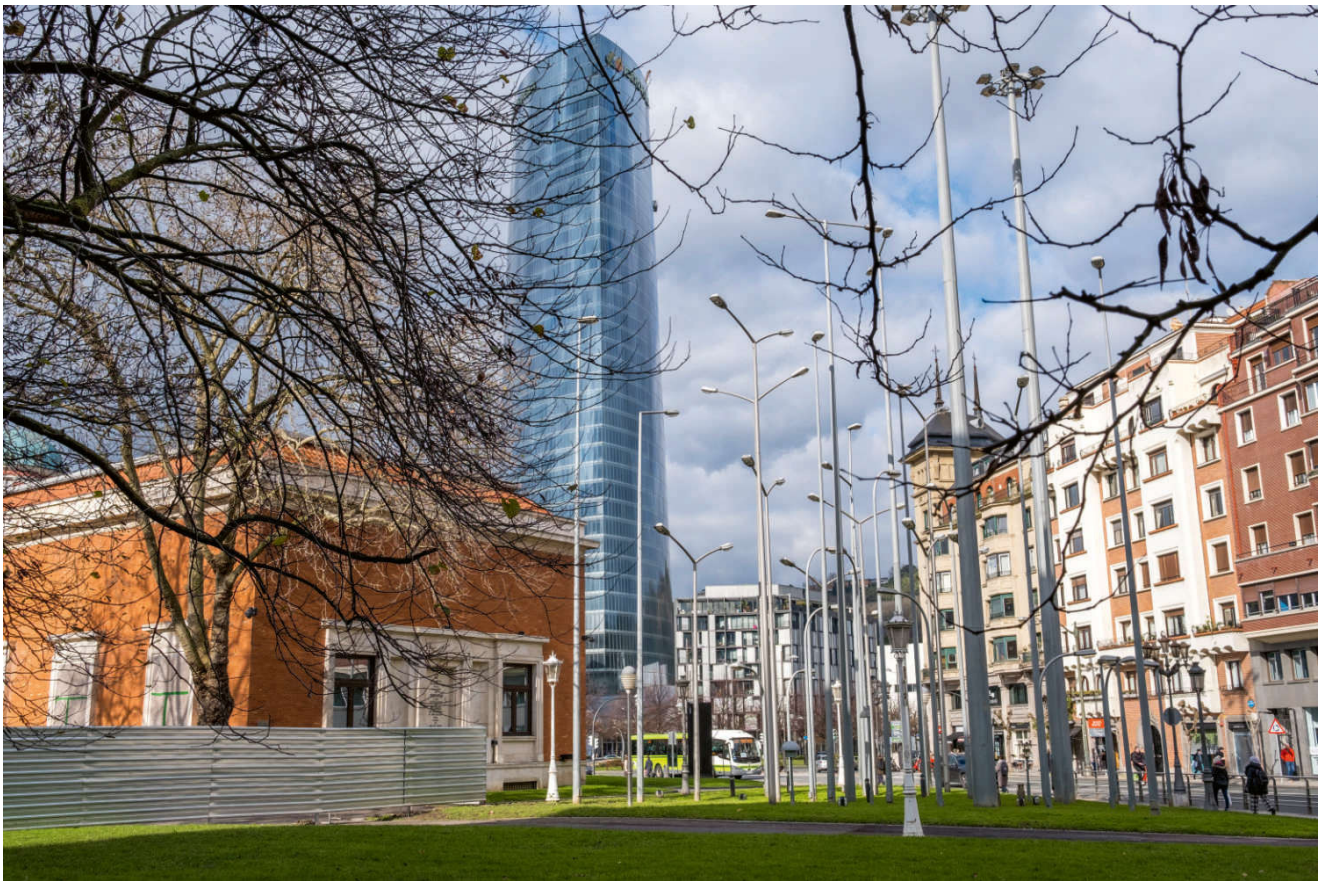
Bilbao er en bemerkelsesverdig by på mange måter...