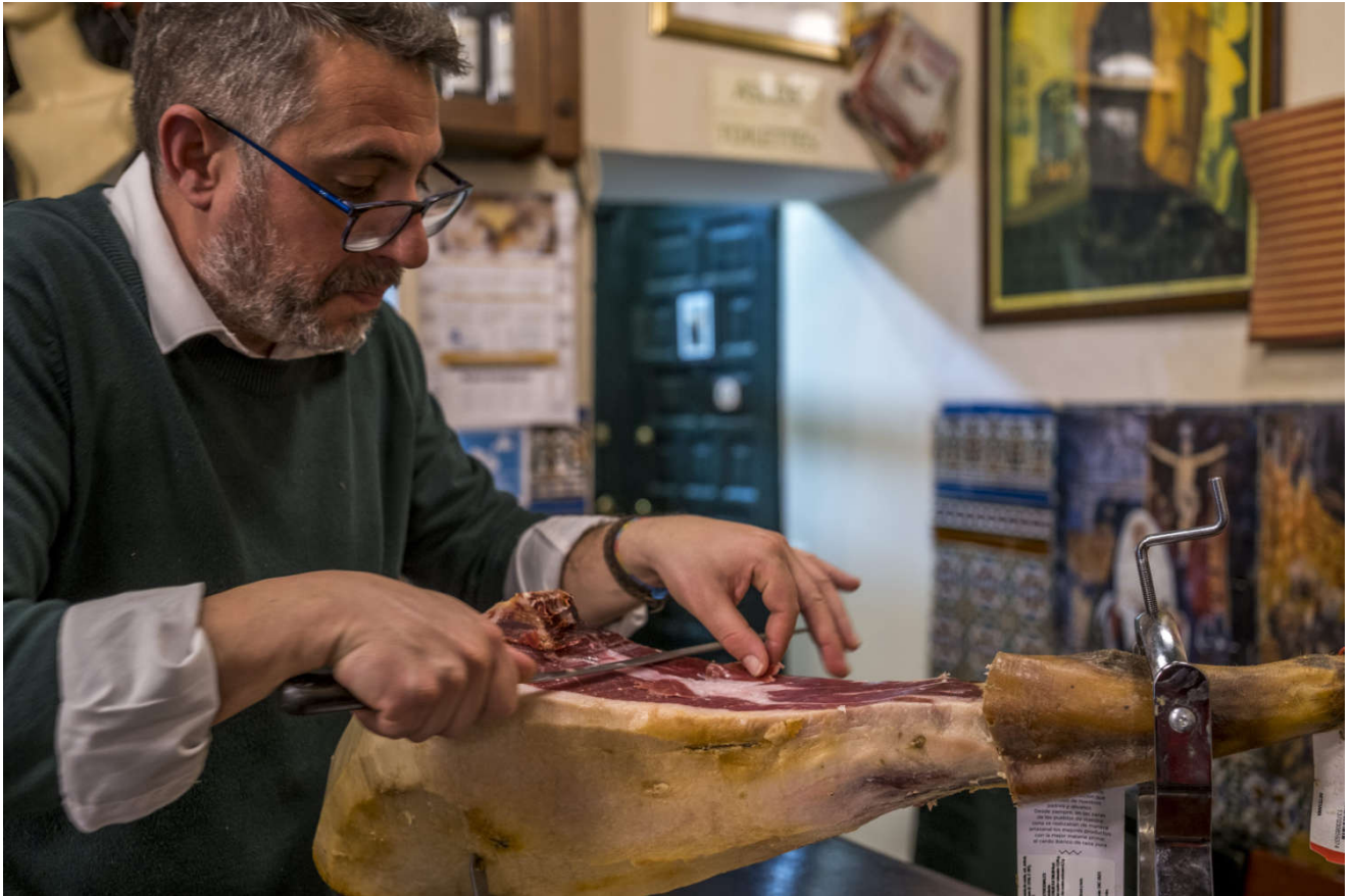
Mat spiller en viktig rolle i spansk kultur.

Etter tre måneder må engelskmennene reise hjem, mens vi andre kan være igjen og nyte sol og høyere temperaturer gjennom hele vinteren. Mange bor i bobilene sine, men vi møter også flere som har trukket med seg campingvogna fra kalde nord.