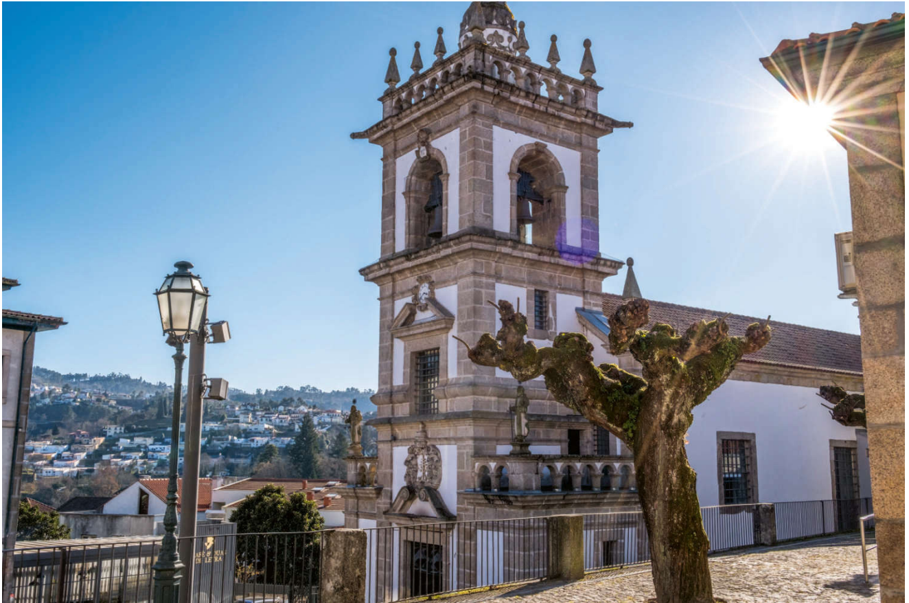
São Pedro-kirken (Peterskirken), med fasade og tårn i barokkstil (1727).