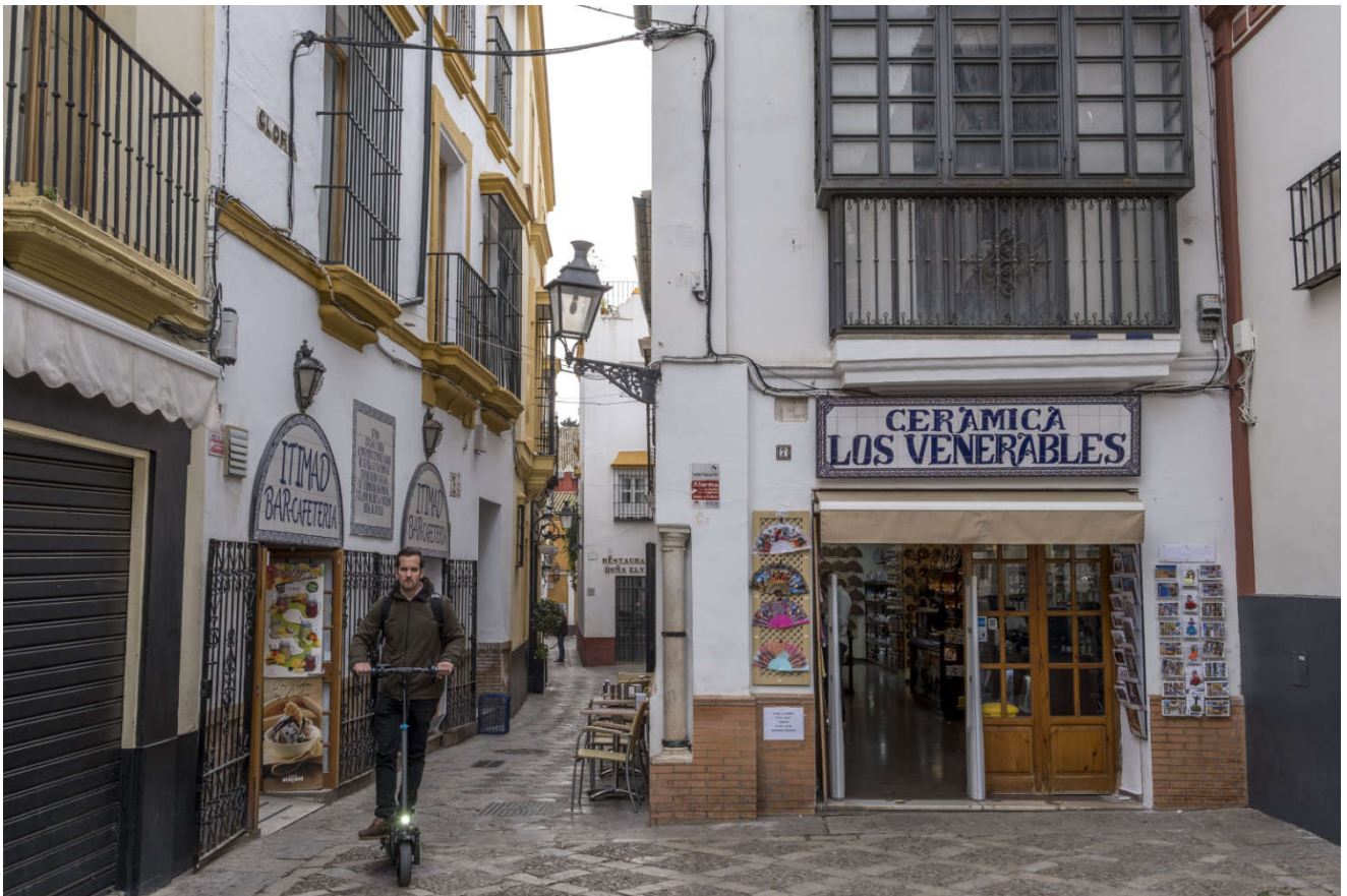
Smale gater, smug – nyt en spasertur gjennom Sevilla.

Når jeg ser tilbake, sier jeg at det er bra at vi ikke snudde. Om kvelden kjøpte vi billetter til katedralen på nettet til neste ettermiddag. I Spania er livet for de over 65 år mye billigere.