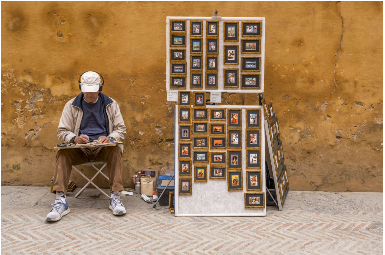
Et nytt minikunstverk hver dag.

Sevilla er også en grønn by, med vakre parker.