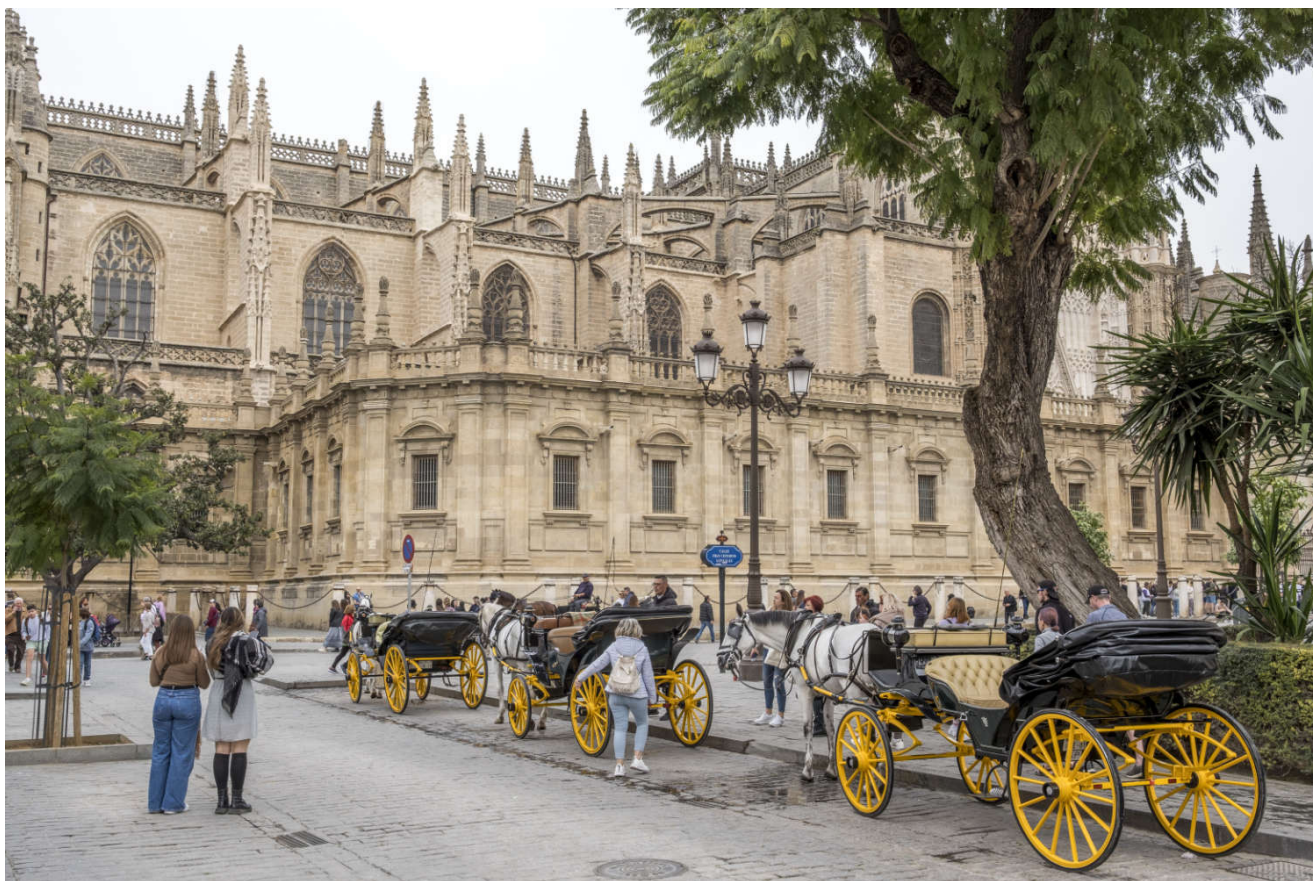
Sevilla: uten tvil den vakreste byen i Spania.

Campingplassen i Dos Hermanas virker som en flott base for å besøke Sevilla. Vi står blant palmer og appelsintrær, bakken har samme farge som en tennisbane. Rundt oss synger den europeiske kanarifuglen sin høyeste sang.