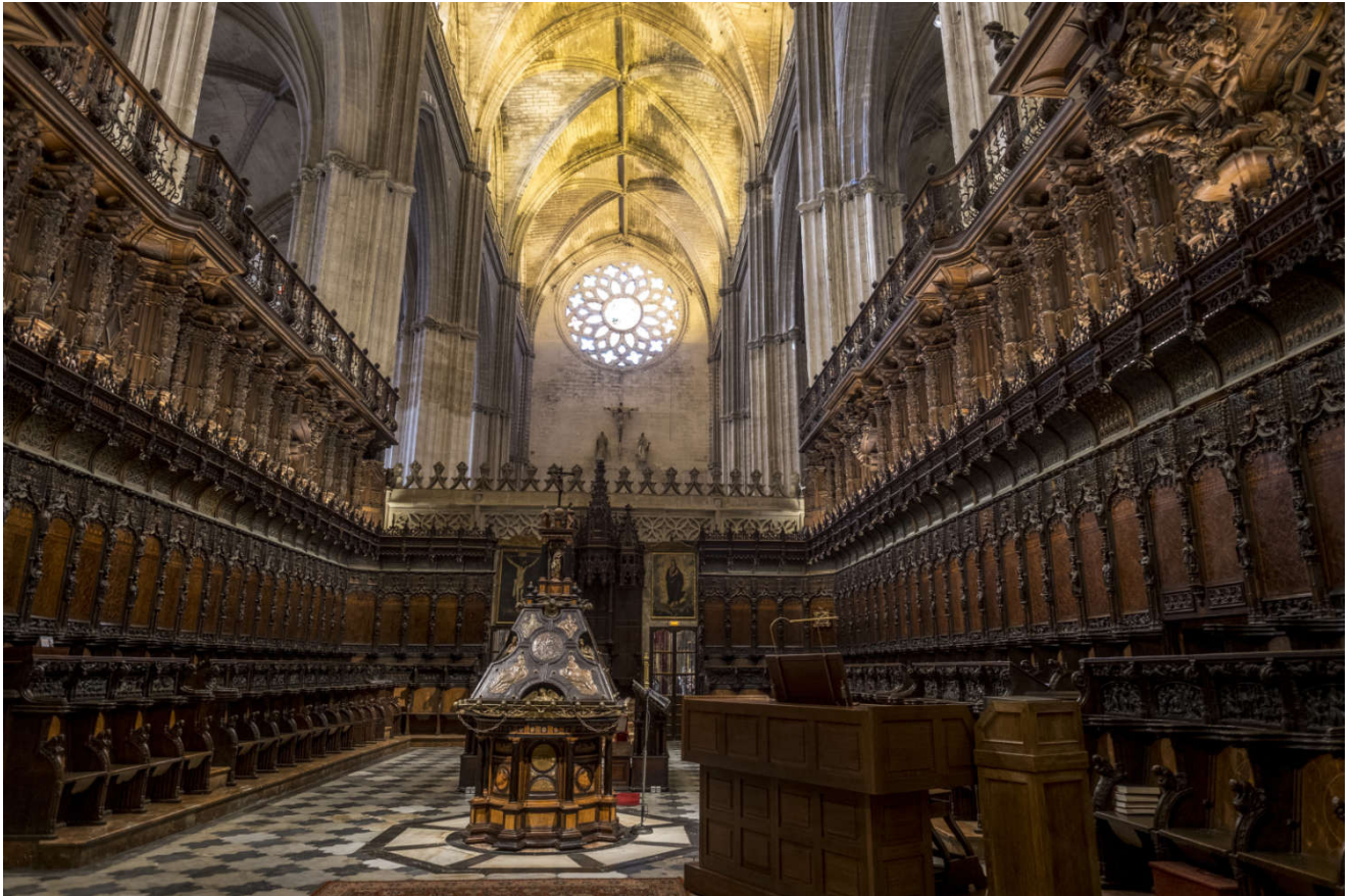
Katedralen i Sevilla er ubeskrivelig vakker.