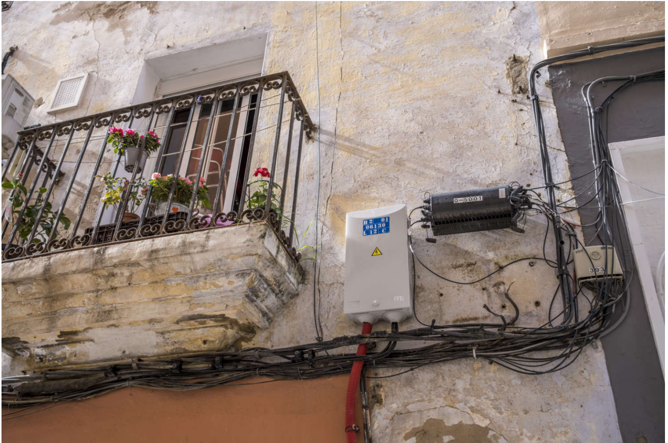
Elektrisitet i Spania: Det er forbløffende hver gang alt fungerer.

Da vi igjen kjørte videre og så på landskapet vi passerte, tenkte jeg på en artikkel fra en utenrikskorrespondent i en avis i Spania jeg nylig hadde lest, og som likte «tomheten» i Spania. Alle de plassene man har her uten å ha planer for dem.