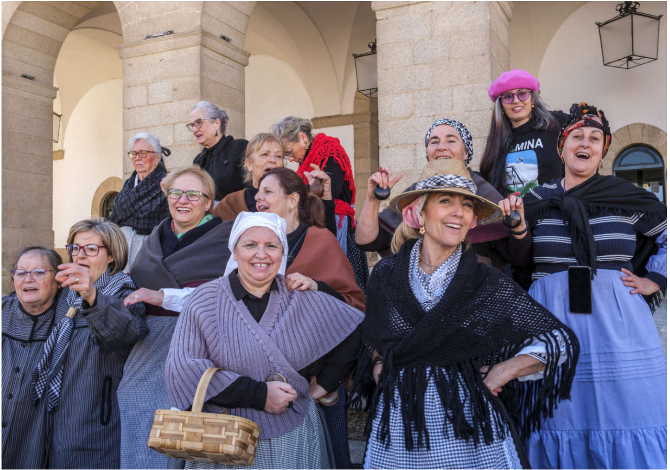
Det var karnevalstid i byen Cáceres da vi kom dit. Vi ble blant annet møtt av dette damekoret som sang så flott.

Journalisten flyttet inn i bobilen sist vinter og dro på tur mot Portugal. Det kan du lese om her . Men det er en stund til han og fruen flytter inn i ny bolig så det blir flere reportasjeturer til sydligere deler av Europa. Her kan du lese hva Sør-Spania kan by på: