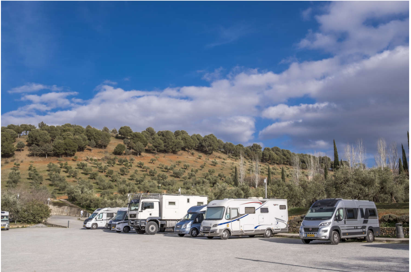
Parkeringsplass P4, er i gangavstand fra inngangen til Alhambra.