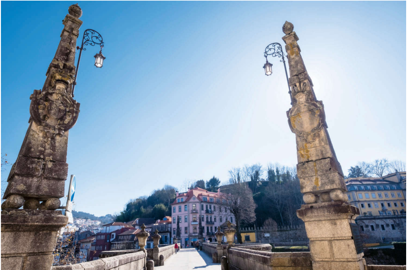
Broen over Tâmega.

Dersom vannstanden tillater det kan du gå langs elven for å få en fin utsikt over São Gonçalo-broen. Det klarte vi heldigvis første dag, men dagen etter lå stien under vann.