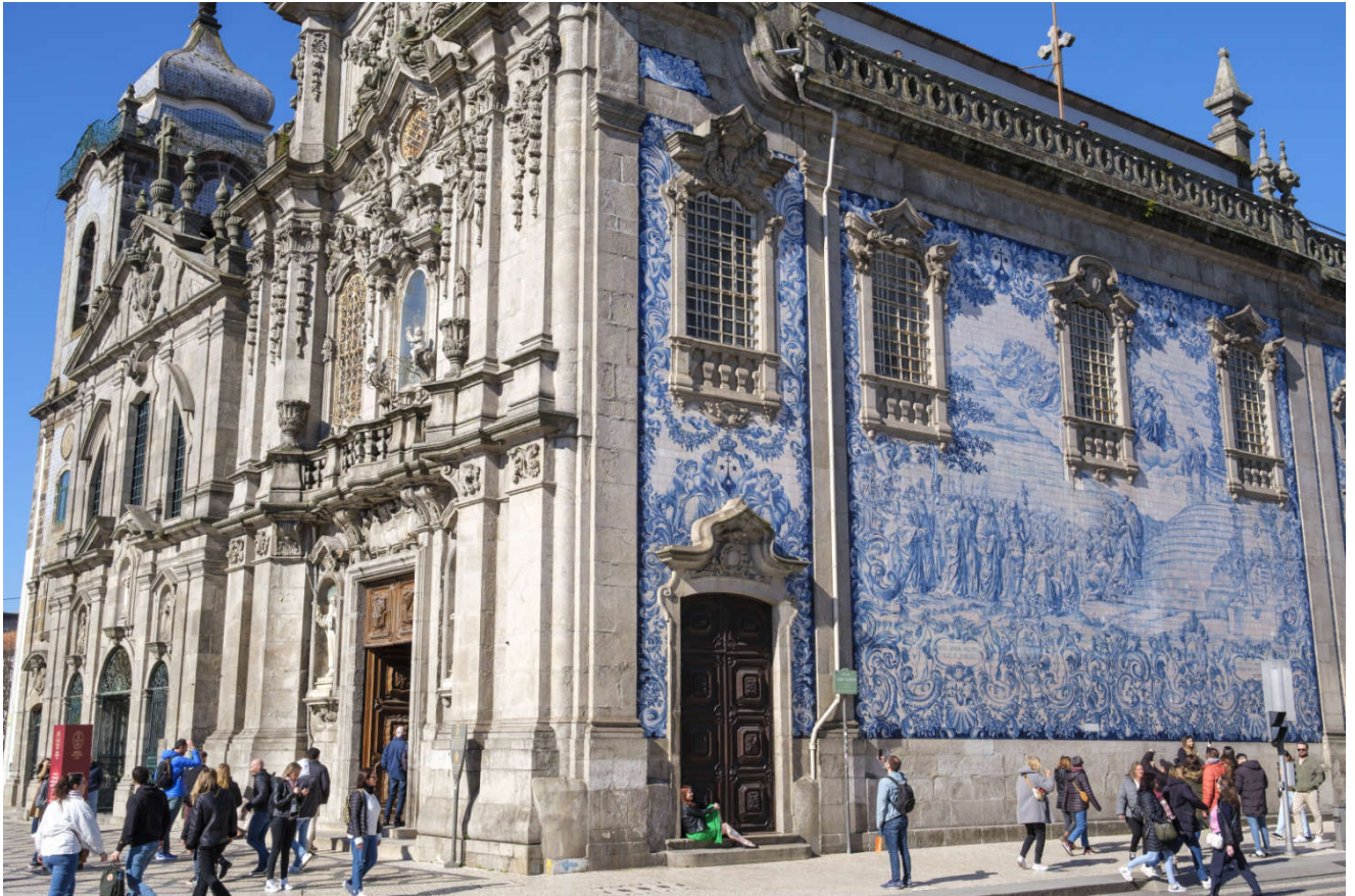
Porto er en vakker by full av ekstraordinære bygninger.

Vi så på nok en katedral og en barokkirke, og var selvsagt innom den berømte handlegaten Rua Santa Catarina, ferskvaremarkedet Mercado de Bola og togstasjonen.