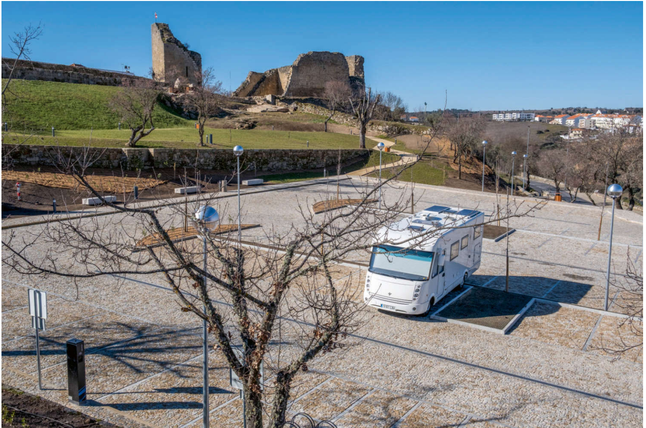
Parkering ved ruinene i Miranda do Douro.

Det var blitt lørdag, og det var veldig stille på veien da vi kjørte videre til Portugal. Her var Miranda do Douro målet vårt, og via e-post fra campingplassen ble vi ønsket velkommen.