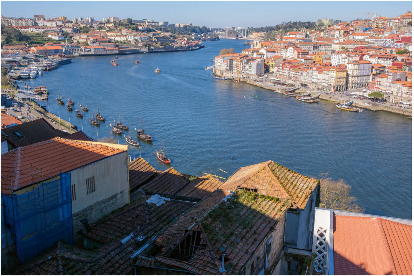
Utsikt over Porto.