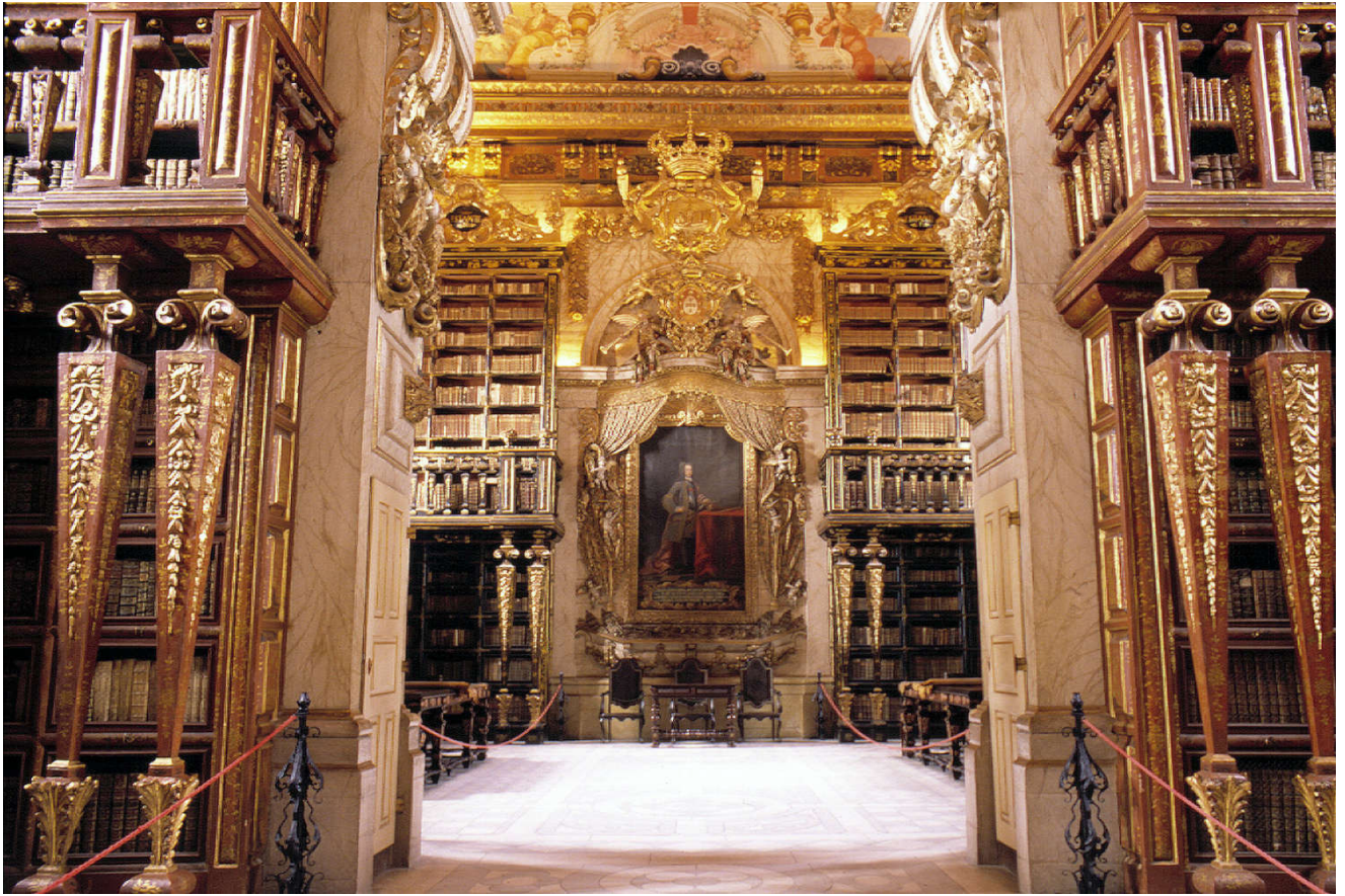
Høydepunktet på omvisningen på universitetet.

Mye av universitetet er åpent for alle, og vi spiste varm mat i kantina. Her spiste vi både kjøtt, fisk, grønnsaker, pommes frites og fikk flasker med vann, som ikke kostet mer enn 13 euro for to stappette voksne personer.