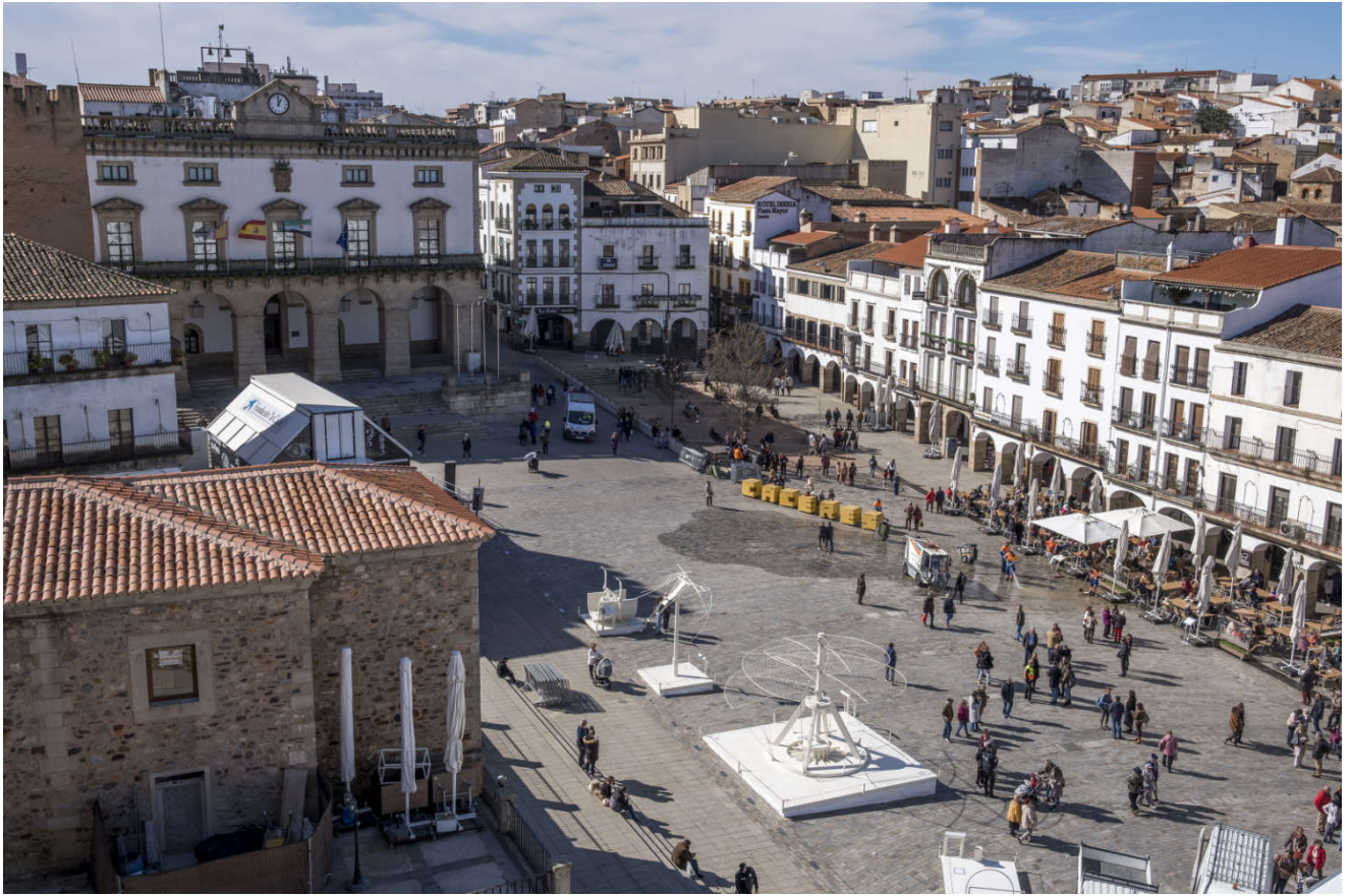
Vi klatrer opp i et tårn for å få utsikt.

Vi havnet også midt i et karneval i Cáceres. Damene sang at det er en glede, akkompagnert av spansk klapping. Deretter ble vi invitert til å klatre opp i et tårn, og vi lot oss ikke be to ganger.