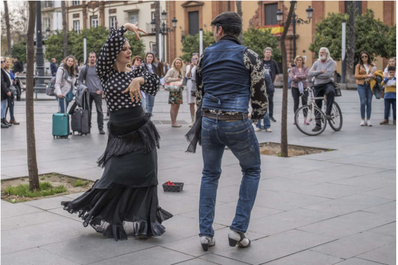
Flamenco danses også lidenskapelig utendørs.

Etter en konkurranse ble den tyske ingeniøren Jürgen Mayers tegninger foretrukket. Ifølge juryen klarte han å integrere antikken i et konsept i tråd med de arkitektoniske ideene til Santiago Calatrava og Antoni Gaudí.