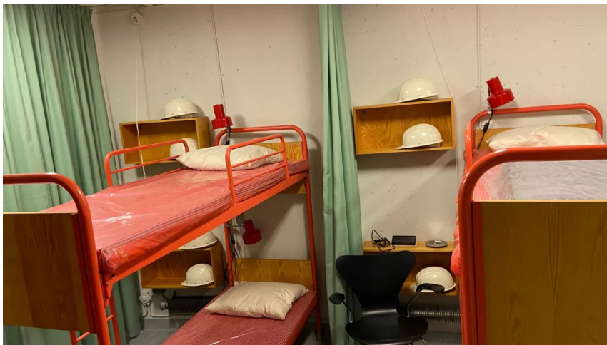
Infirmieriet i Regan Vest.

"Jeg er helt bevidst om, at vi har forskellige indtægtsniveauer i befolkningen, og der er mennesker, der ikke lige kan få de penge op af pungen. Men omvendt har vi ikke ubegrænset adgang til offentlige midler, og jeg har et ansvar for museets økonomi. Og jeg tænker, at debatten også havde været der, hvis prisen havde været 200 eller 125 kr."