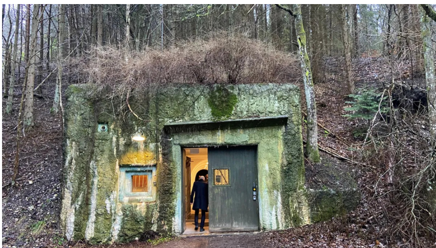
Indgangen til selve bunkeranlægget afslører intet af, hvad der gemmer sig i dybet.

"Og i tilfælde af krig, og Regan Vest skulle i brug, så måtte maskinmesteren efterlade familien uden for bunkeren. Dem var der ikke plads til," fortæller vores guide, museumsdirektør ved Nordjyske Museer, Lars Christian Nørbach.