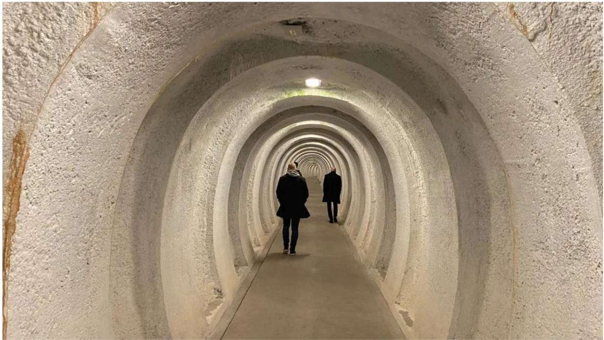
Nu kan atombunkeren Regan Vest omsider slå dørene op for publikum. Kom med ned i den tophemmelige bunker, der er udset til at blive Nordjyllands nye turismemagnet.