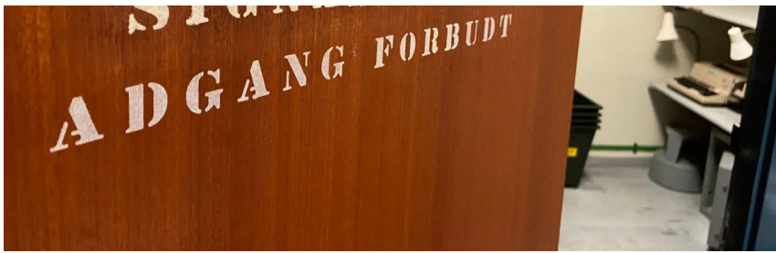
Prisen for at besøge Regan Vest har skabt debat.