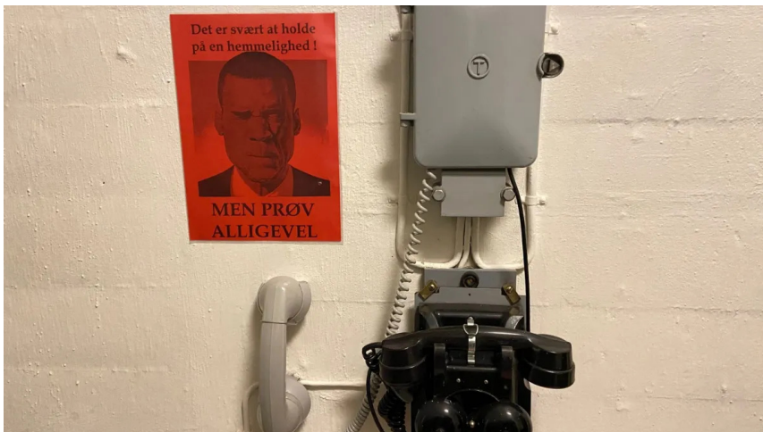
Regan Vest var et tophemmeligt anlæg. Små plakater skulle minde brugerne om, at de skulle være varsomme med at dele informationer.

"Når kopimaskinen skulle serviceres, måtte teknikeren føres hertil med bind for øjnene. Ingen måtte vide, hvor anlægget lå," fortæller vores guide.