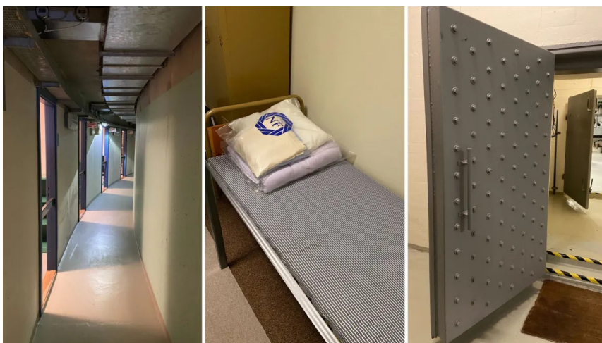
Lange gange med kontorer og opholdsrum i Regan Vest. I midten den seng, der var reserveret til regenten. Til venstre de tunge døre, der leder ind i anlægget.

Længere inde gemmer sig kontorer og beboelsesrum. Et infirmeri, cafeteria og opholdsrum. Nogle af de største rum er konferencelokalerne med gigantiske landkort på væggen.