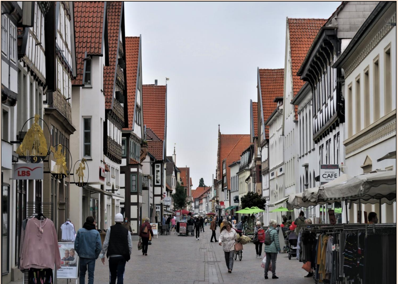
Et par indtryk fra den hyggelige bymidte, som overrasker med bindingsværk og lidt mere nordlig stemning. Helt varmt er det ikke, og den ellers indbydende café på torvet mangler da også kunder.