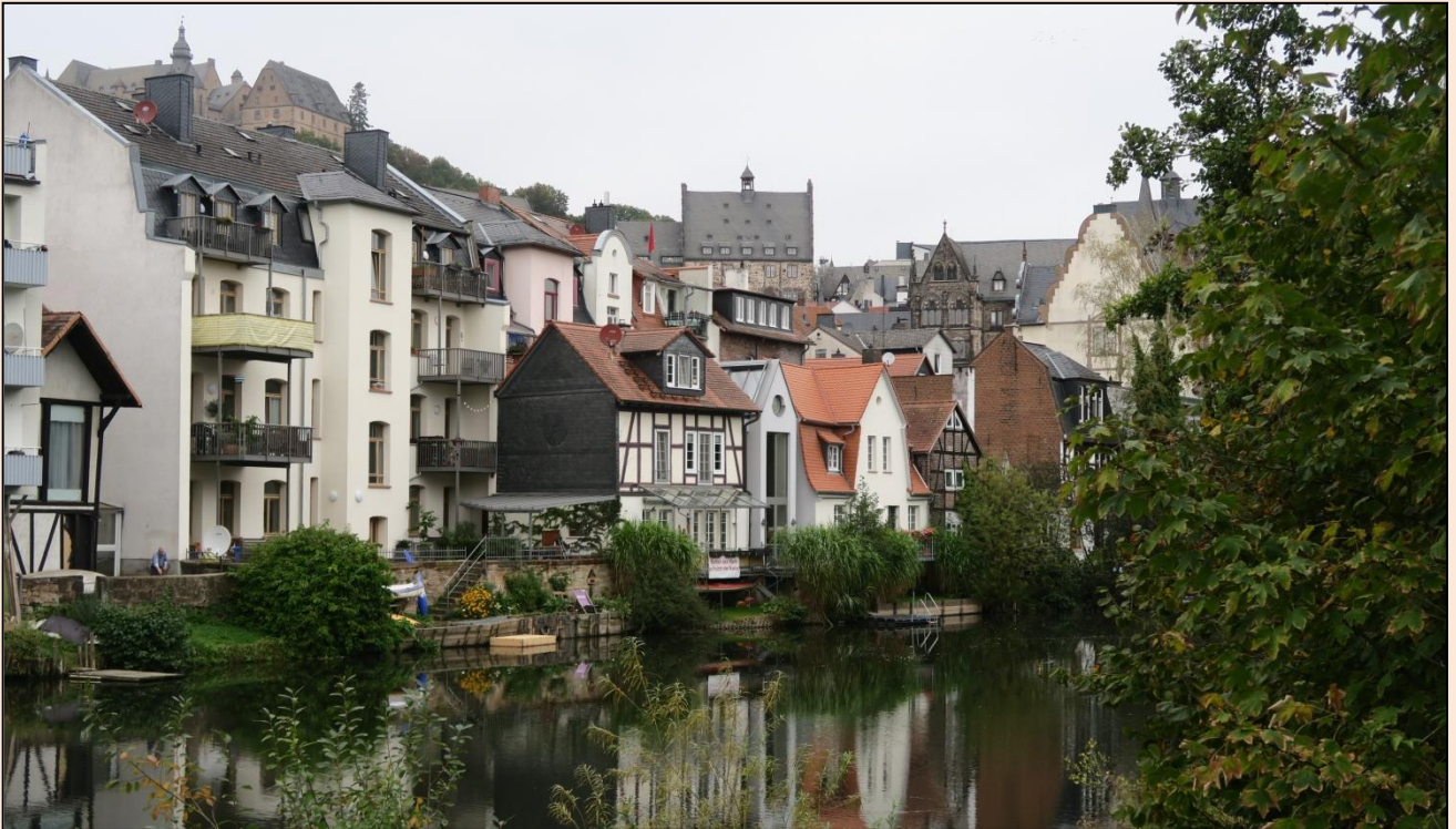
Den korte spadseretur ind til Altstadt går langs floden Lahn . Slottet skimtes øverst oppe til venstre.

Byen domineres normalt af mange unge mennesker, der sørger for liv i gaderne. Flertallet af dem er studerende, idet Marburgs gamle universitet er meget eftertragtet uddannelsessted. Desværre virker byen på en udefinerbar måde som sat på stand-bye, især her i det truende regnvejr. Men der er jo også stadig semesterferie, som i Tyskland varer længere end herhjemme.