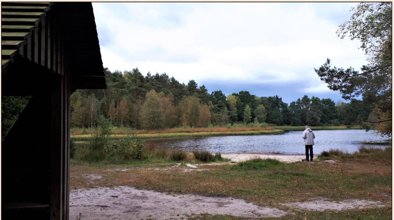
Man kan gå rundt om søen, men det giver vi afkald på. Turen herud til og hjem igen må være nok til at vedligeholde dagens kondital.

Men Lüneburger Heide bliver det alligevel heller ikke denne gang. Måske er en søndag jo ikke det mest ideelle tidspunkt? Vejret er ikke det allerbedste, så vi vegeterer til om eftermiddagen, inden det kribler i os igen, for nu skal der ske noget. Det bliver en ca. 2-timers vandretur gennem højbenede egetræs- og fyrreskove ad lange, lige vandrestier hen til skovsøen Ahlterer Flatt (billede).