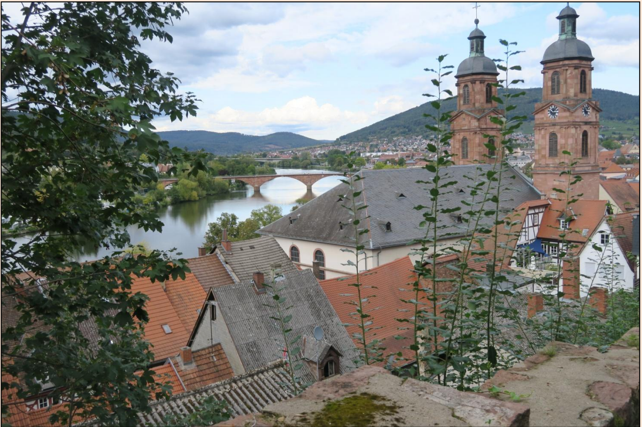
Kig ned mod floden Main oppe fra området omkring slottet. Campingpladsen ligger lige ved broen.

På Gasthaus Riesen - "Deutschlands älteste", oplyser indskriften på gavlen – spiser vi Schweinebraten mit Rotkohl und Semmelknödel + Weizen og spadserer derefter videre, gennem hyggelige Schwarzviertel og derefter stejlt op til borgen. Miltenberg ER altså en overvældende, meget smuk lille by.