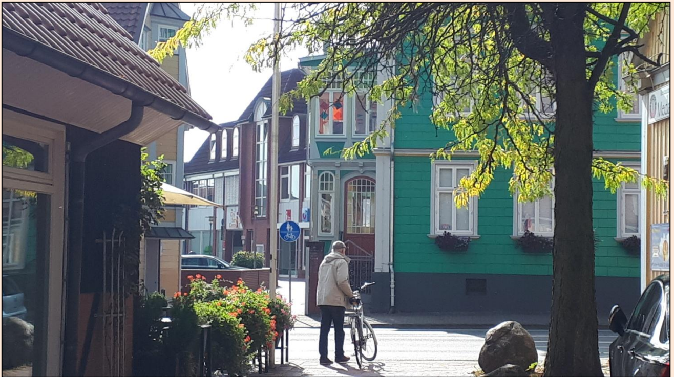
Ankommet til centrum. Det grønne træhus er "Spielemuseum"; et museum for leg og/eller legetøj?

Midt på eftermiddagen er vi allerede tilbage igen, og nu kan man endda sidde i et stykke tid i solen. Vi har planer om i morgen at tage camperen og køre til Wilseder Berg midt i Lüneburger Heide , for bagefter at vende tilbage hertil.